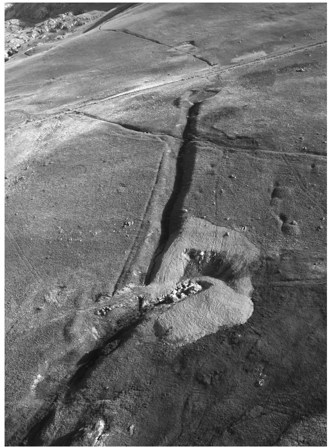
Figure 2 : Le canal de l'Écluse. Figure 2: Canal de l'Écluse.

d'un couloir boisé identique à ceux que montre l'iconographie du xvi e siècle (voir La circulation des hommes et des matériaux ).