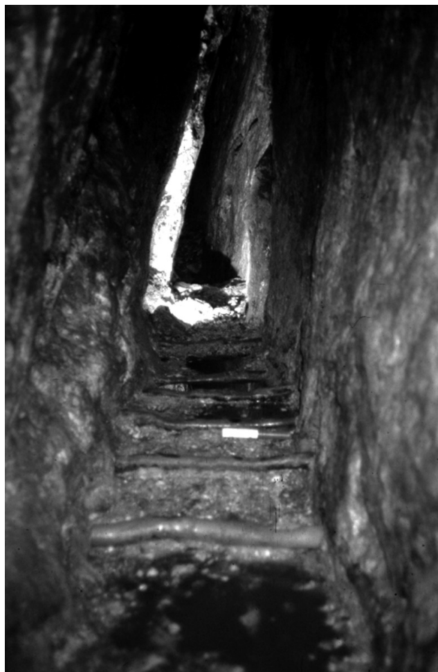
Figure 4 : (Voir planche couleur) Voie de circulation aménagée au sol de deux galeries à Brandes, destinée à faciliter le passage de traîneaux à patins.

La même adaptation s'observe pour la circulation verticale. Les chantiers miniers de l'Écluse ont conservé toute leur charpenterie de mine. Des planchers étaient encore en place, sur la totalité de la longueur des zones d'exploitation. Des rondins de bois, calés en force entre les parois des dépilages, supportaient des planches. De la mousse, coincée dans les interstices, faisait office de calfatage. Ces aménagements avaient plusieurs fonctions : ils participaient à la circulation horizontale et verticale des mineurs, ils servaient également à stocker des stériles sous terre. Un puits était aménagé à l'extrémité d'un ancien chantier, il faisait communiquer les travaux souterrains avec la surface. Les parois avaient été redressées sur trois côtés. L'une d'elles servait