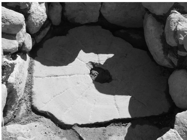
Figure 8 : Meules à minerai de Brandes, ici réemployée comme fond de bassin.

Le quartier occidental du village est entièrement occupé par des aménagements hydrauliques et des bassins de lavage du minerai, s'étagant sur plusieurs terrasses. Au total, 29 bassins ont été mis au jour; quatre se trouvaient à l'intérieur d'ateliers alors que les autres étaient en aire ouverte. Les premiers bassins mis au jour étaient « isolés » en ce sens qu'ils n'étaient pas mitoyens, et parfois même assez distants les uns des autres. La fouille de l'aire jouxtant le tracé aval de la canalisation C1 a permis de retrouver des bassins qui s'organisent en grappe, de formes différentes, occupant des terrasses étagées. Quelle que soit leur situation topographique, ces bassins se répartissent selon trois principales catégories : circulaires, ovales ou quadrangulaires (fig. 9). Tous étaient entièrement comblés avec du sable.