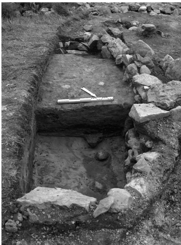
Figure 9 : Bassin ovale implanté en aire ouverte sur une terrasse contenant plusieurs bassins.

Figure 8: Millstones ore, here recycled as a basin floor.