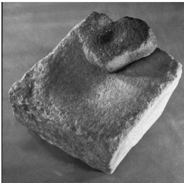
Figure 7 : Modèle de mortier et de percuteur. Figure 7: Mortar for crushing ore with stone stickler.

Les installations qui permettaient de procéder au broyage sont plus délicates à interpréter. L'agglomération se termine, sur son flanc occidental, par une vaste canalisation (C1) qui