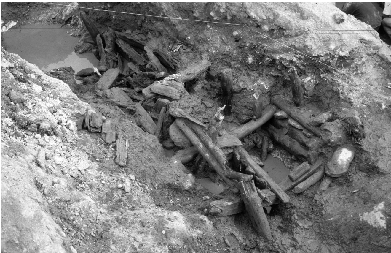
Figure 5 : Couloir boisé, vue d'ensemble au moment de la fouille. Figure 5: A wooden corridor to protect entrances and miners.

recouvertes par des argiles de colluvionnement, le tout sur une épaisseur de 10 m environ. Afin d'atteindre la roche, les mineurs ont pratiqué, avec succès, la technique du décapage par chasse d'eau grâce au canal de l'Écluse. À partir de sa mise en évidence, les mineurs ont suivi le gisement en creusant directement dans l'argilite et en installant un couloir boisé au fur et à mesure. Au contraire des chantiers sis à l'ouest du village, ouverts dans un filon massif encastré dans des gneiss, la roche encaissante des chantiers de l'Écluse est de la dolomie et le filon se subdivise en un faisceau de filons plus ou moins importants, chacun ayant donné lieu à un chantier. Deux couloirs boisés, au moins, étaient encore visibles, dont un particulièrement bien conservé. Dans le prolongement du puits décrit plus haut, un cuvelage de planches était maintenu en place par un alignement de poteaux verticaux, poteaux doublés du côté où les poussées de terre étaient les plus importantes. Les planches, débitées en rayons, et par conséquent de section triangulaire, se superposaient de façon à former une paroi étanche. La première différence avec les couloirs boisés de l'iconographie est que celui-ci était couvert. Des poutres horizontales, assemblées par tenons/