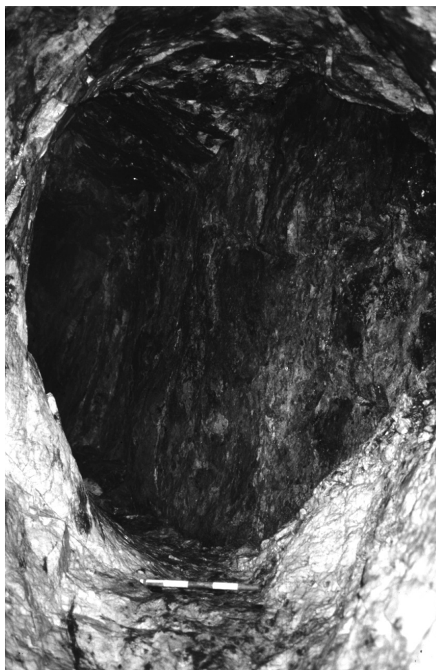
Figure 3 : (Voir planche couleur) Forme arrondie des galeries caractéristique de l'abattage par le feu. Figure 3: (See colour plate) A gallery face work bearing fire and Tools marks.

À Brandes, deux techniques ont coexisté : l'abattage par percussion et l'abattage par le feu. Malgré l'absence de bois, l'extraction s'est principalement faite par le feu. Les galeries sont de forme arrondie, avec des parois curvilignes, caractéristiques de cette technique (fig. 3). L'examen des chantiers a montré que les mineurs préparaient les fronts de taille de façon à guider l'action des flammes. Il semble que le minerai et sa gangue, peu résistante quand il s'agit de baryte, étaient abattus à l'outil et que la technique du feu était réservée aux zones stériles : élargissement des galeries dans l'encaissant (le gneiss) une fois le filon enlevé, galeries de recherche, etc. Un front de taille terminant une courte galerie de recherche conserve les traces très lisibles des deux techniques employées de façon concomitante : coupole d'abattage par le feu et stries de l'outil ayant permis de purger la roche attendrie après l'action des flammes.