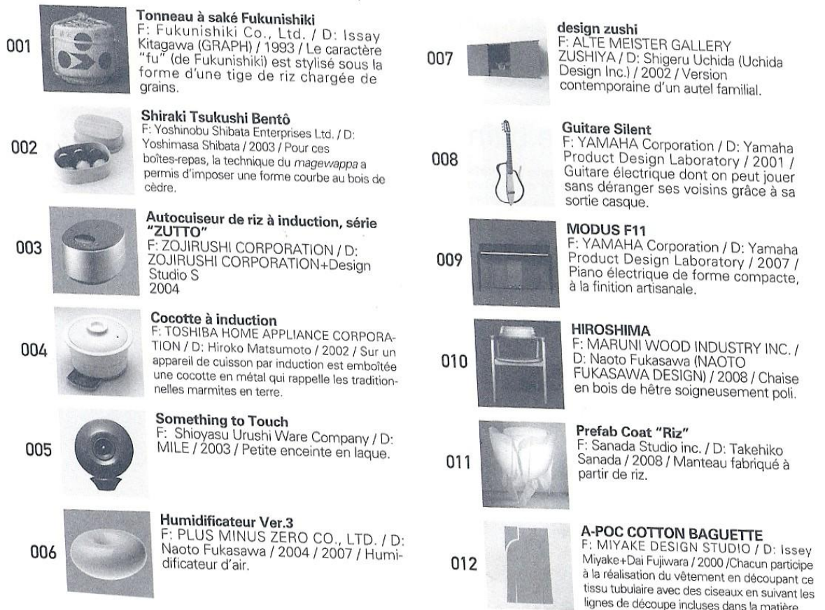
Figure 2: Présentation des objets du premier couloir de l'exposition de la MCJP

Ce couloir mène à une vaste salle sombre, aux murs tendus de toile noire, et décorée de pan de tissus blancs suspendus au plafond. 160 objets y sont annoncés par le dépliant comme constituant un panorama représentatif des objets utilisés au quotidien par les Japonais