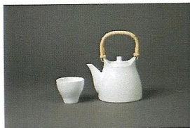
Théière et tasse à thé en porcelaine blanche Sori Yanagi / Ueda Toseki © Yanagi Design Institute