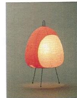
AKARI 1AT Isamu Noguchi © OZEKI & Co., Ltd.