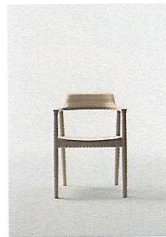
HIROSHIMA Naoto Fukasawa