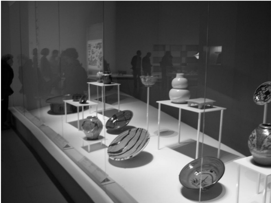
Figure 1 : Une vitrine de l'exposition Mingei

Une grande salle ronde au fond de galerie d'exposition est consacrée à « trois créateurs internationaux au Japon » ayant œuvré entre 1930 et 1950 : l'Allemand Bruno Taut (laques), l'Américain Isamu Noguchi (luminaires, meubles, terres cuites), et la Française Charlotte Perriand (mobilier). L'espace « Yanagi Sôri et la question du design » est réservé aux créations les plus célèbres du designer, fils de Sôetsu, réalisées des années 1950 à 1970 : par exemple, le tabouret Butterfly , créé en 1956, est mis en valeur dans une vitrine séparée.