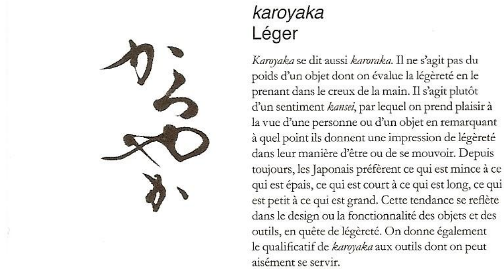
Figure 5 : Présentation de la "valeur" karoyaka (la brochure l'associe au concept de kokoro )

de l'objet : il est associé à un concept en japonais, lequel est calligraphié, puis transcrit en alphabet romain, avant d'être éventuellement traduit, et, enfin, viennent les explications (cf figure 5).