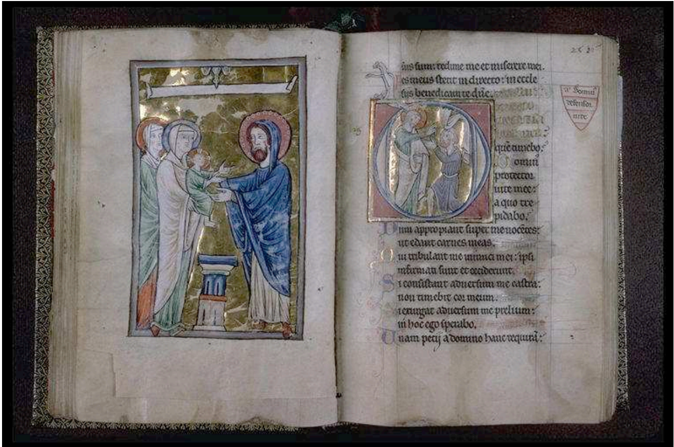
BM Lyon, ms 539, Psautier de July, première moitié du XIIIe siècle. F. 36 v - 36 bis.