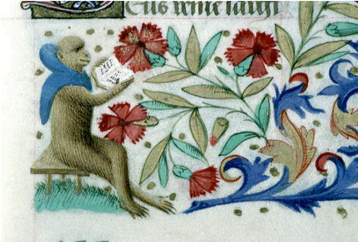
BM Lyon, ms 6022, livre d'heures, 1450-1460. F. 158, détail.

Au nombre de ses quelque cinq cents livres manuscrits venus du Moyen Age, le fonds ancien de la Bibliothèque municipale de Lyon conserve de beaux et riches exemplaires décorés et peints, dont les images sont aisément consultables en ligne, faute de pouvoir être directement admirées sur les feuillets de parchemin 1 . L'écran lisse de l'ordinateur, les choix de la numérisation et la dématérialisation de l'objet ne doivent toutefois faire oublier le corps et l'épaisseur du livre, les exigences de sa fabrication, les aléas de sa conservation, et surtout la présence initiale d'un lecteur instaurant un rapport personnel, sensoriel et intellectuel, avec son ouvrage. La réalité d'un livre dépend essentiellement de son lecteur, comme le figure, dans une variante décorative ou parodique, ce singe encapuchonné, assis dans l'une des marges fleuries d'un manuscrit du XV e siècle.