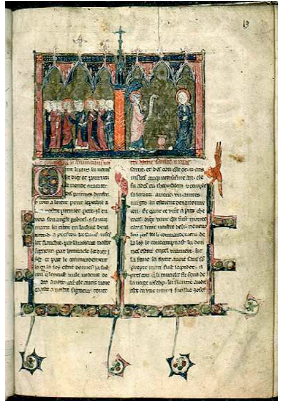
BM Lyon, ms 867, Recueil de vies de saints , fin du XIII e siècle. F. 19 : Mariage de Marie et Joseph, Annonciation.

Toutefois, dans son apparence, le tout est unifié par une écriture aérée et régulière, et une distribution classique sur deux colonnes, le volume mesurant 29,5 X 20,2 cm. L'encre employée est noire, exception faite des passages rubriqués correspondant au début de chaque portion de récit, et aux citations évangéliques ponctuelles laissées en latin. Des encarts historiés sont attachés aux premières lignes rubriquées de chaque section, et ils les suivent ou les précèdent, indifféremment. La sobriété ornementale prime : aucune enluminure en pleine page, les marges sont laissées vides avec leur réglure en évidence. Seuls deux folios ont reçu un décor complet (f. 3 et f. 19). La peinture vient enserrer le texte, le flanque d'une initiale fleurie, le coiffe en haut de page d'une grande enluminure double, et le cerne d'un bandeau à redents qui remonte le long des trois marges. L'ornementation se déploie en appendices végétaux, avec les fleurons couronnant les édifices d'encadrement des miniatures. Des antennes s'épanouissent en volutes denticulées sur les bords externes. Et au sommet des tiges de l'entrecolonne et de la marge de gouttière, l'enlumineur a perché des figures chimériques munies d'instruments de musique.