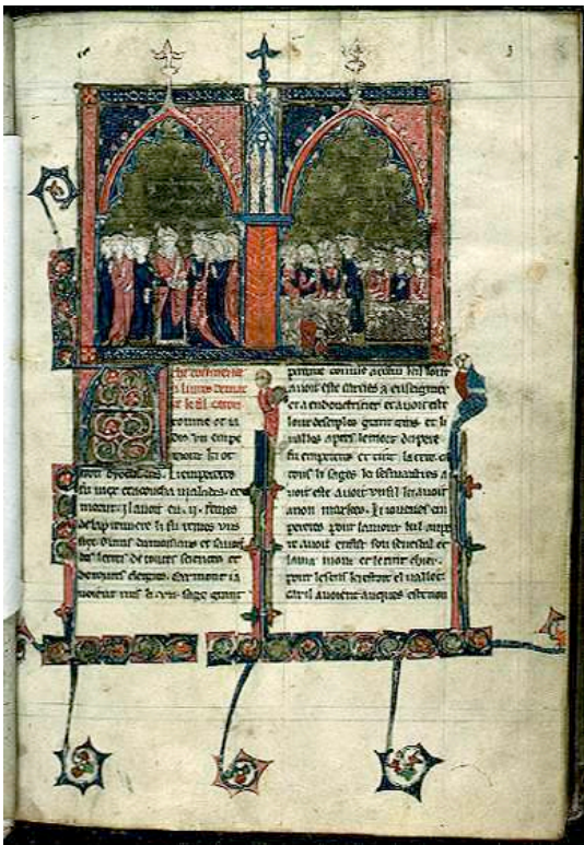
BM Lyon, ms 867, Recueil de vies de saints , fin du XIIIe siècle. F. 3 : Mariage de Fiséus, Banquet ( Roman de Marques de Rome ).