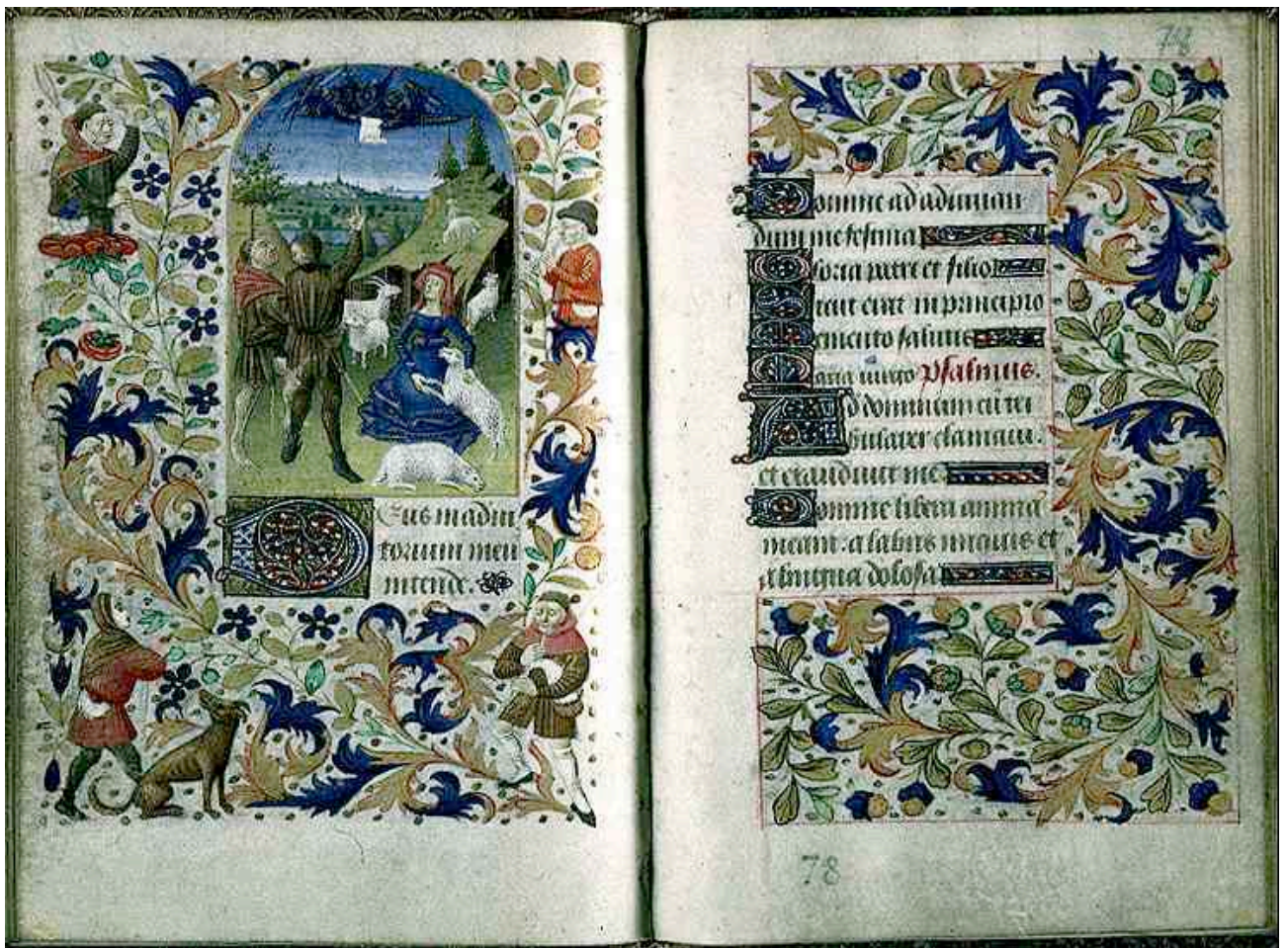
BM Lyon, ms 6022, livre d'heures, 1450-1460. F. 77 v - 78 : petit office de la Vierge, Annonce aux bergers et début de tierce.

Durant le Moyen Age tardif et encore au XVI e siècle, spécialement en France, en Flandre et dans les Pays-Bas, le livre d'heures a connu une telle diffusion qu'il a pu être qualifié de best-seller médiéval. A côté des ouvrages les plus luxueux qui ont fait sa renommée, commandités par les princes et les rois, le livre d'heures a été décliné en de multiples exemplaires, de facture excellente ou plus médiocre, qui témoignent de son succès auprès de toutes les catégories aisées de fidèles laïcs. Car, si les plus célèbres répondaient à une commande exclusive de leurs propriétaires, beaucoup, et non les moins beaux, se trouvaient en vente à l'étal des libraires, d'occasion ou neufs, déjà reliés ou en feuillets séparés, dans l'attente d'ajouts personnalisés ou de la somme que le client était prêt à débours 4 .