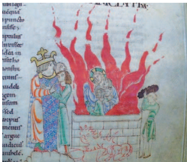
Fig. 8. Dijon, Bibliothèque Municipale, ms. 14, f. 64

La visione della fornace in questa immagine acquista una tonalità anagogica: Cristo che, al posto dell'angelo del Signore, prende tra le braccia i tre fanciulli Ebrei richiama infatti potentemente le rappresentazioni del seno di Abramo, figura del paradiso 40 . Del resto, anche il tema dei fanciulli salvati nella fornace è tradizionalmente una prefigurazione della salvezza dell'anima 41 . Il creatore delle immagini ha saputo dunque fondere le due formule iconografiche per comporre una sapiente rappresentazione che evoca il Paradiso e gli eletti. In questo contesto, appare chiaro che la personificazione del fuoco che brucia i servitori del re o i Caldei, in primo piano nell'immagine, mostra per contrasto la sorte che attende i dannati. La miniatura rappresenta dunque una vera e propria visione dell'aldilà, con il paradiso e l'inferno, a partire dal racconto biblico dei tre ebrei nella fornace, offrendo un'interpretazione anagogica di questo episodio.