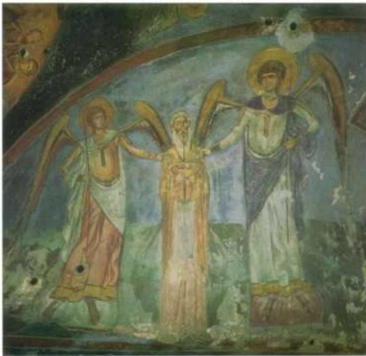
Fig.9 Néophyte entre deux anges, bêma (C. Jolivet-Lévy)