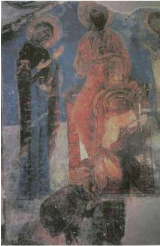
Fig.8 Déisis Néophyte en donateur au pied du Christ, cellule (C. Jolivet-Lévy)