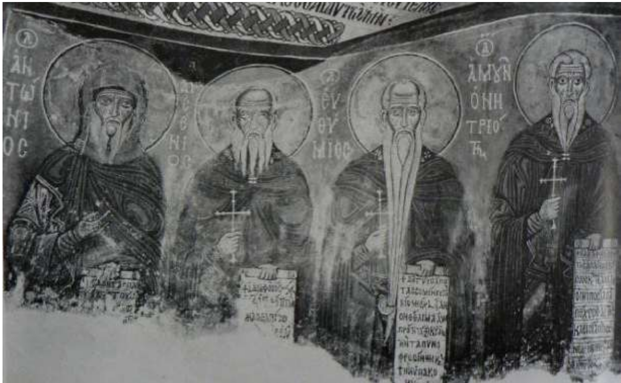
Fig.6 Figure de saint Euthyme dans le naos (C. Mango et E. Hawkins)