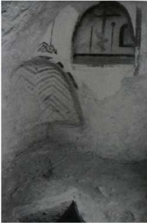
Fig.4 Vue intérieure de la cellule, ouverture de l' hagiasterion (C. Mango et E. Hawkins)