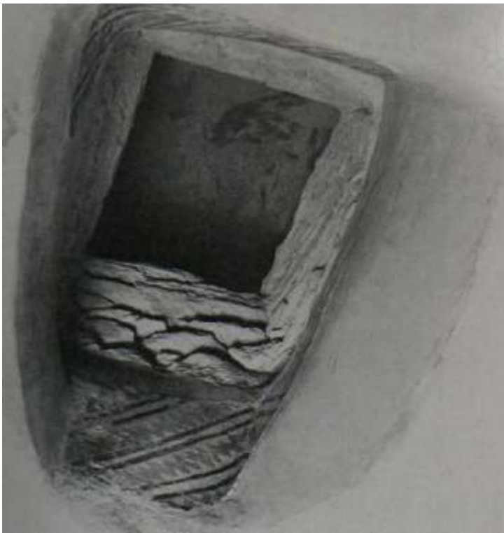
Fig.5 Vue de la nef, ouverture de l' hagiasterion (C. Mango et E. Hawkins)