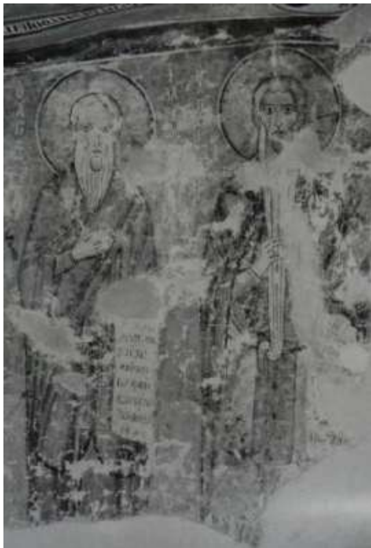
Fig.7 Figure de saint Euthyme dans le béma (C. Mango et E. Hawkins)