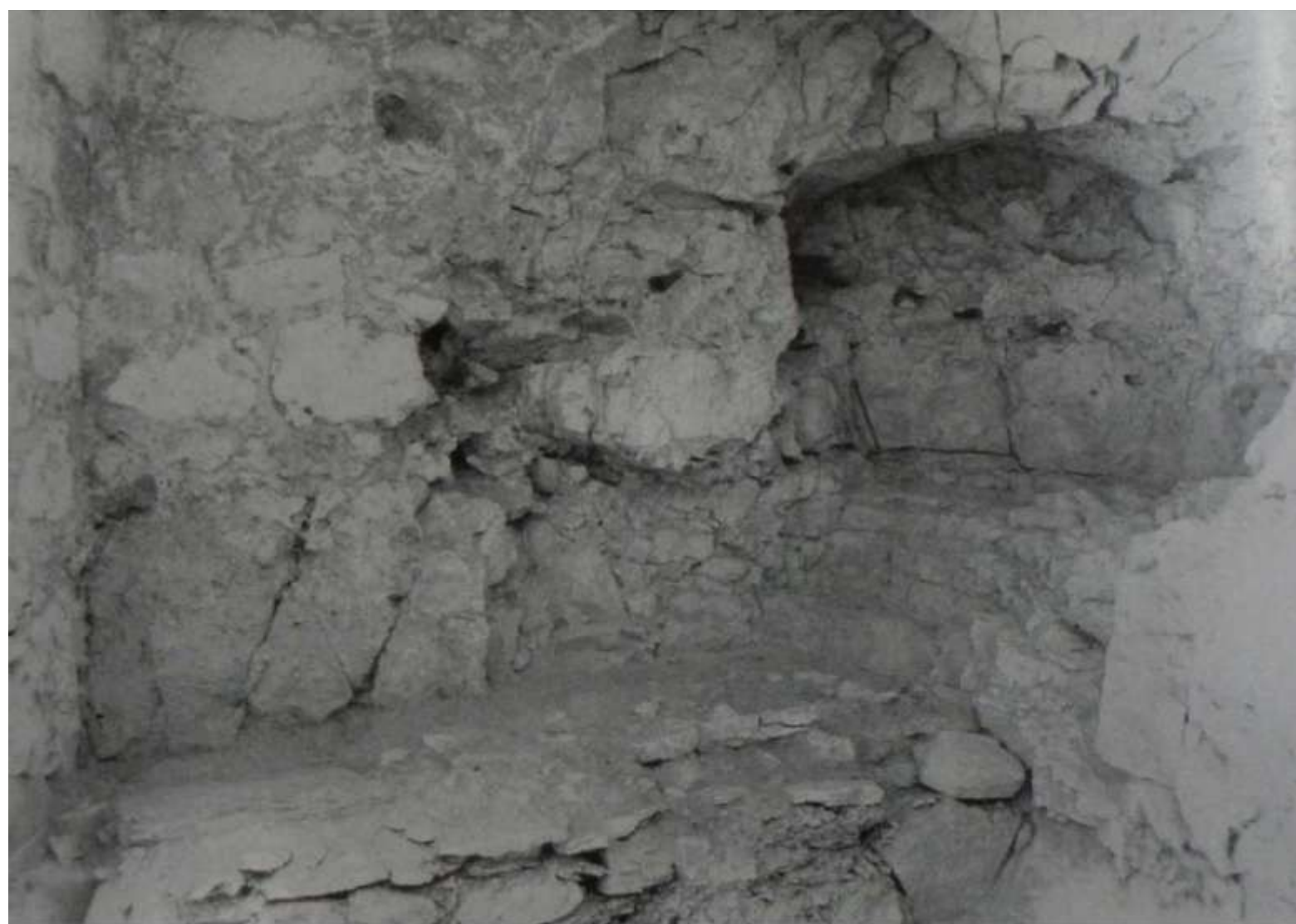
Fig.3 La seconde cellule de Néophyte, la Nouvelle Sion (C. Mango et E. Hawkins)