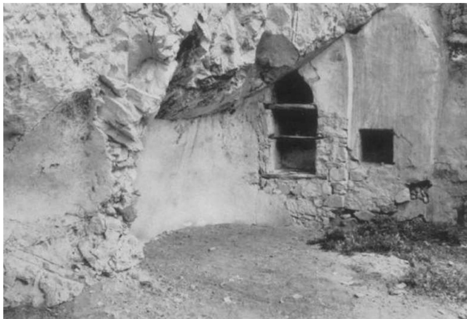
Fig.1 Cellule bâtie et rupestre du monastère de la Sainte-Croix (C. Mango et E. Hawkins)