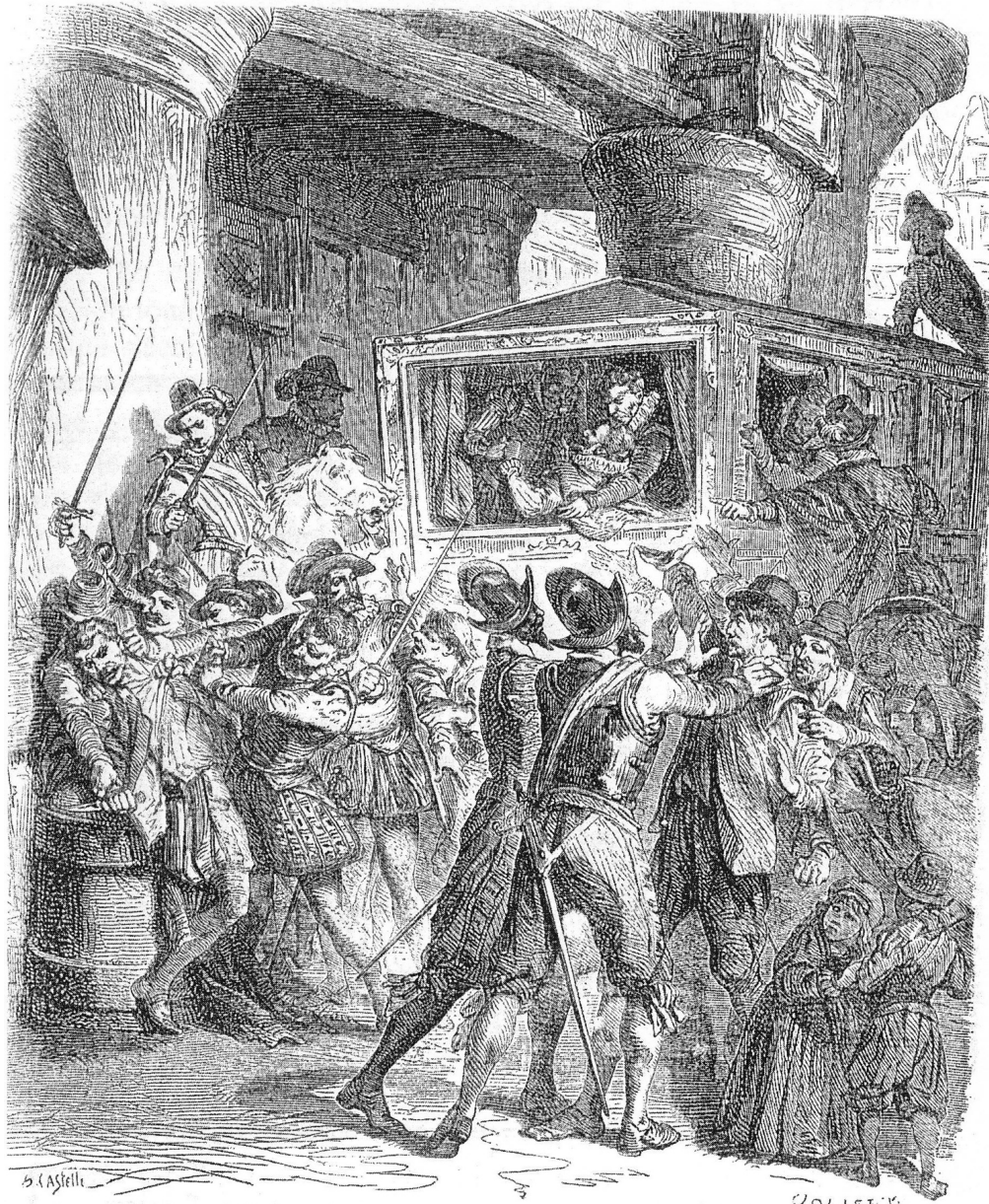
Assassinat de Henri IV rue de la Ferronnerie (14 mai 1610).