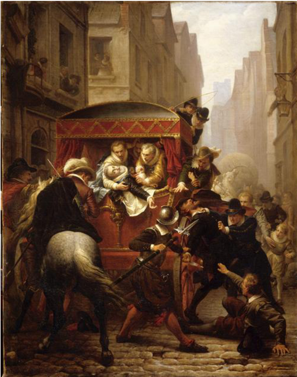
Peinture à l'huile, signée « G. Housez 1860 », exposée au Salon des artistes français, Paris, 1859 (Pau, musée national du Château).