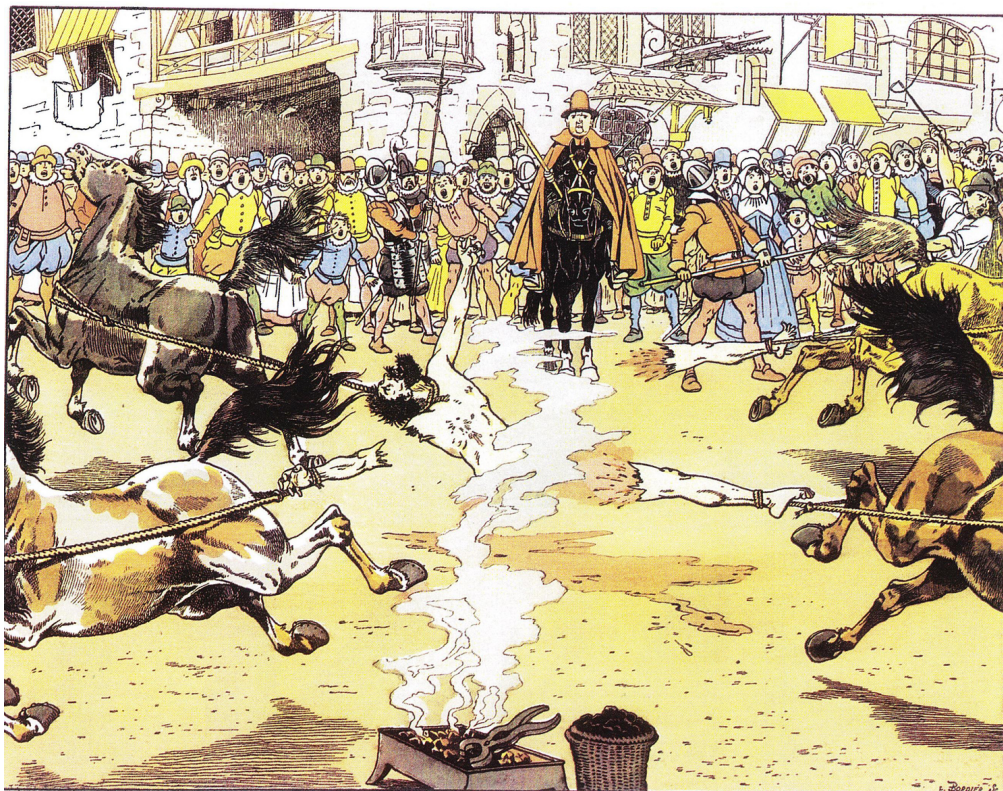
Ravaillac est condamné à être tenaillé aux mamelles et aux membres, et écartelé. Le peuple furieux s'attelle aux cordes