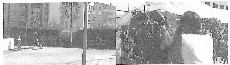
Cour d'école : à gauche : un artiste, une Atsem 5 , deux élèves, un « tunnel » en construction ; à droite : une enseignante saisit l'avancement du travail des élèves et de l'artiste (de dos, au fond).

Un commentaire d'une de mes photos de famille me fit parler de « l'imprécision des témoins numériques 1 ». C'était un paysage enneigé, saisi depuis ma fenêtre, image d'un film qu'on enclenchait dans une crémaillère et qui, ce jour-là, avait autorisé un cliché de plus. À présent, le mot numérique résonne curieusement. Dans ce qu'on nomme de nos jours « l'ère numérique 2 », le chercheur peut intégrer à ses données des images collectées à l'aide d'outils peu encombrants. Le rapport entre images et sciences humaines et sociales peut-il ignorer cette réalité ? Doit-on faire fi de « l'intensité du raz-de-marée numérique 3 », génératrice d'un usage pluriel et diffus de l'image 4 auquel le chercheur n'échappe pas ? Dans le travail de recherche que je mène à Lyon depuis 2004 sur un « programme de résidences d'artistes en école maternelle », d'autres professionnels évoluent avec ces prothèses légères, enregistrant, avec préméditation ou