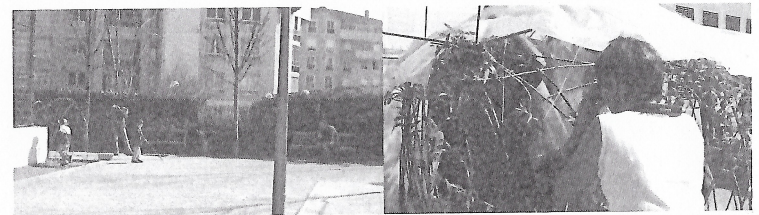
Cour d'école : à gauche : un artiste, une Atsem 5 , deux élèves, un « tunnel » en construction ; à droite : une enseignante saisit l'avancement du travail des élèves et de l'artiste (de dos, au fond).

Un commentaire d'une de mes photos de famille me fit parler de « l'imprécision des témoins numériques 1 ». C'était un paysage enneigé, saisi depuis ma fenêtre, image d'un film qu'on enclenchait dans une crémaillère et qui, ce jour-là, avait autorisé un cliché de plus. À présent, le mot numérique résonne curieusement. Dans ce qu'on nomme de nos jours « l'ère numérique 2 », le chercheur peut intégrer à ses données des images collectées à l'aide d'outils peu encombrants. Le rapport entre images et sciences humaines et sociales peut-il ignorer cette réalité ? Doit-on faire fi de « l'intensité du raz-de-marée numérique 3 », génératrice d'un usage pluriel et diffus de l'image 4 auquel le chercheur n'échappe pas ? Dans le travail de recherche que je mène à Lyon depuis 2004 sur un « programme de résidences d'artistes en école maternelle », d'autres professionnels évoluent avec ces prothèses légères, enregistrant, avec préméditation ou