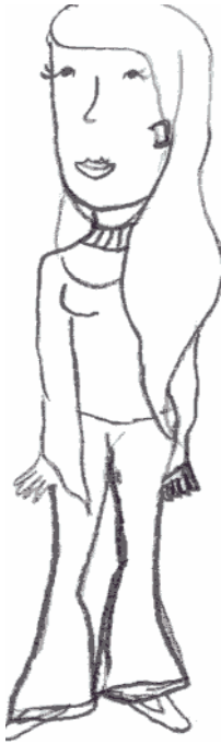
Fig. 1 : M.D. 10 ans 6 mois. Pratique la danse classique depuis 4 ans et demi. Sens du mouvement, des formes, des détails et de l'esthétique.