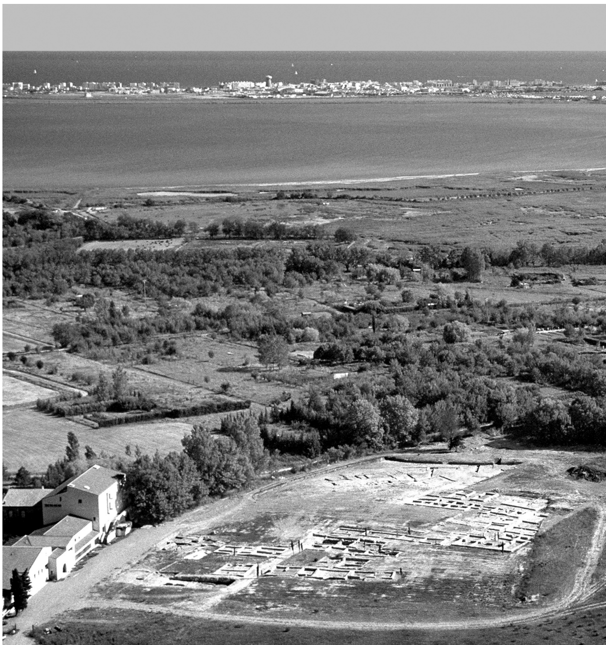
Fig. 2 – Vue aérienne de la cité protohistorique de Lattara.

Lattes était le développement et l'adaptation de méthodologies nouvelles pour la fouille archéologique, notamment en contexte historique, période qui présentait alors un certain retard dans ce domaine.