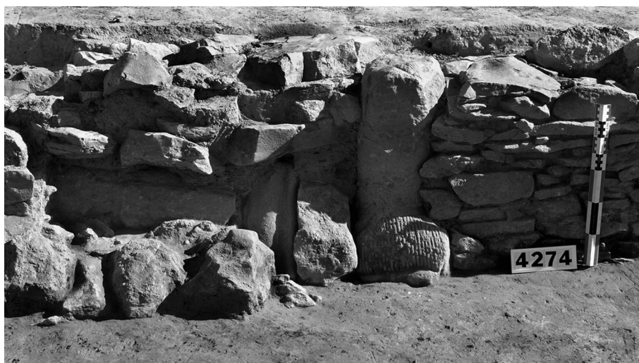
Fig. 41 – Réemploi de la statue de guerrier de Lattes comme piédroit de la porte méridionale de la pièce 5 de la maison 52101. Vue prise du sud.

En 2002, une statue en ronde bosse a été découverte dans la ville antique de Lattara . Cette sculpture ayant déjà fait l'objet d'une publication descriptive détaillée (Py, Dietler, 2003 ; Dietler, Py, 2003), on s'attachera ici à en discuter la signification dans le contexte de la fondation de la cité.