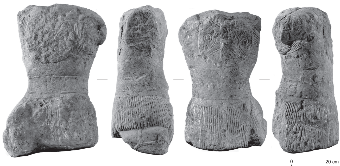
Fig. 42 – Les quatre faces du guerrier de Lattes.

connu, tant en Espagne qu'en Languedoc occidental : il est par exemple présent dans les tombes 14 et 15 de la nécropole du Grand Bassin II à Mailhac (Janin et al. , 2002), dans la tombe de Corno Lauzo à Pouzols-Minervois (Taffanel, Taffanel, 1960) et dans la tombe 75 de la nécropole de las Peyros à Couffoulens (Passelac et al. , 1981). Dans tous ces cas, l'objet est accompagné de mobiliers datables entre 525 et 475 av. J.-C. au plus tard.