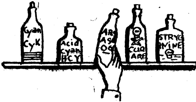
Ill. 1 – « Les joies du poison », illustration de Favrot-Houllevigne, vers 1933.

d'empoisonnement » ? D'autant qu'elle n'a utilisé que des ustensiles domestiques : une tasse de thé, un verre d'eau, une casserole, une bassine. À la fin du XIX e siècle, d'autres objets s'identifient aux poisons : la seringue du docteur Bougrat, les envois postaux « envenimés » provoquant une mort foudroyante. De la Première Guerre mondiale à nos jours, les procès placent sur le devant de la scène de nouveaux objets encore : rouges à lèvres mortels, parapluies redoutables, pots de yaourts empoisonnés, médicaments contaminés à dessein. La chronique judiciaire a popularisé auprès d'un vaste public toutes sortes d'objets, soulignant parfois l'embarras d'un criminel qui ne sait plus trop quel produit choisir, comme l'indique le dessin de presse ci-dessous [Ill. 1].