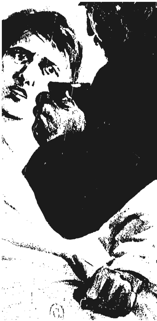
Ill. 4 – « Crimes et châtements. Le docteur Laget », 1931 [coll. part.].

Les objets du poison continuent à inquiéter, qu'ils soient seringues pour injecter le poison dans un pot de yaourt, ou encore flacons de médicament pour nourrir. Aussi, de l'époque moderne à nos jours, ces objets semblent se « démocratiser ». Destinés à une élite au début de l'époque moderne, ils deviennent « vulgaires » au XIX e siècle, et se diffusent dans toutes les classes de la