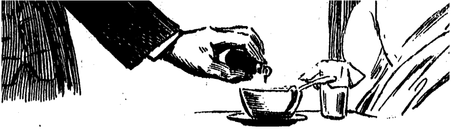
Ill. 5 – « Le drame du poison », vers 1932 [coll. part.].

société. L'arsenic se trouve en libre circulation, parfois dans des boîtes en fer, ou dans des sachets en papier pour se débarrasser des animaux nuisibles. Mais, de nouveau, à partir de la fin du XIX e siècle, des poisons invisibles ou indétectables suscitent auprès des rares spécialistes de nouvelles angoisses. Les « névrosthéniques » notamment, comme la strychnine ou les cantharides peuvent être aisément transportés, dissimulés dans de petits contenants et s'avèrent foudroyants [Ill. 5].