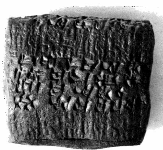
Fig. 18 : FT 3A, seal C.