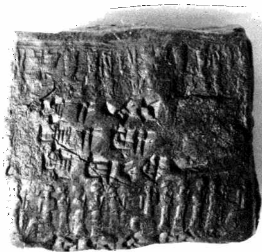
Fig. 17 : FT 3A, seals A (above) and B (below).