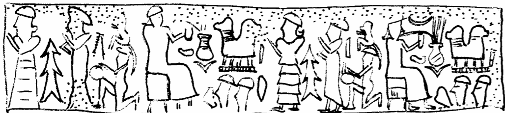
Fig. 16 : FT 3A, seals A-C.