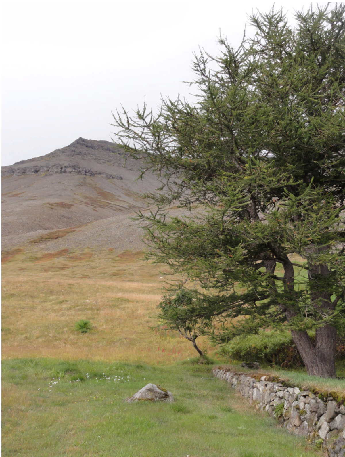
3-4. Quelques images du rapport entre l'enclos de Skríður et le paysage environnant, aux pieds du mont Núpur. Photographies d'Hervé Brunon, septembre 2012.

Skríður, Núpur. Premio Internazionale Carlo Scarpa per il Giardino, XXIV edizione, a cura di Patrizia Boschiero, Luigi Latini, Domenico Luciani, Treviso, Fondazione Benetton Studi Ricerche, coll. « Memorie », 2013, p. 150-157