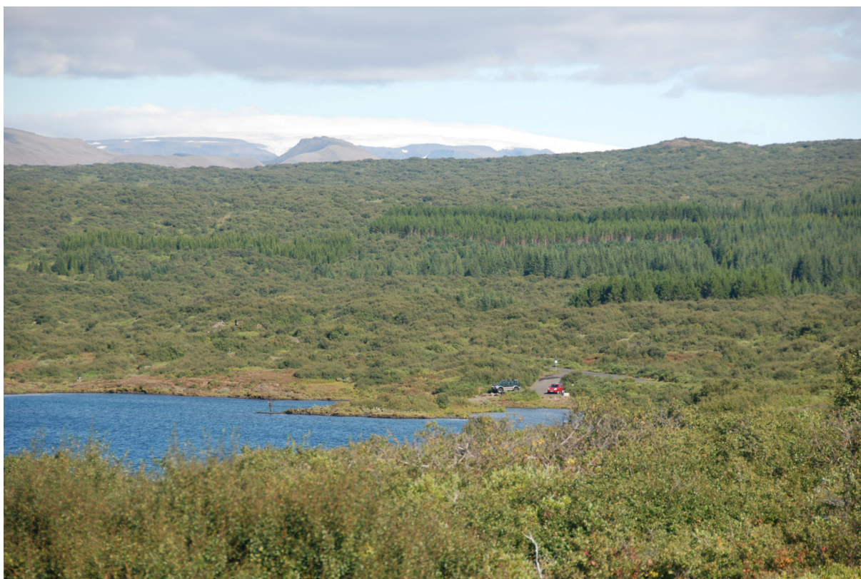
8. Zone boisée dans le parc national de Þingvellir, en bordure du lac de Þingvallavatn.