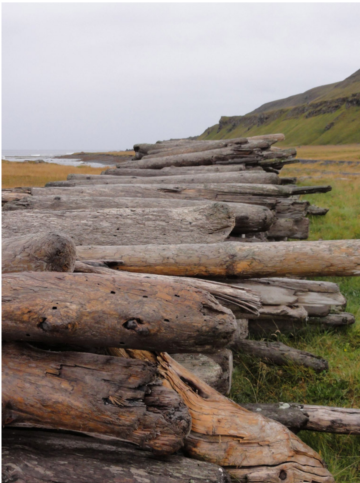
6-7. Amoncellements de bois flotté sur le rivage de la baie Húnaflói, entre Hvammstangi et Hólmavík. Photographies d'Hervé Brunon, septembre 2012

Skríður, Nípur. Premio Internazionale Carlo Scarpa per il Giardino, XXIV edizione, a cura di Patrizia Boschiero, Luigi Latini, Domenico Luciani, Treviso, Fondazione Benetton Studi Ricerche, coll. « Memorie », 2013, p. 150-157