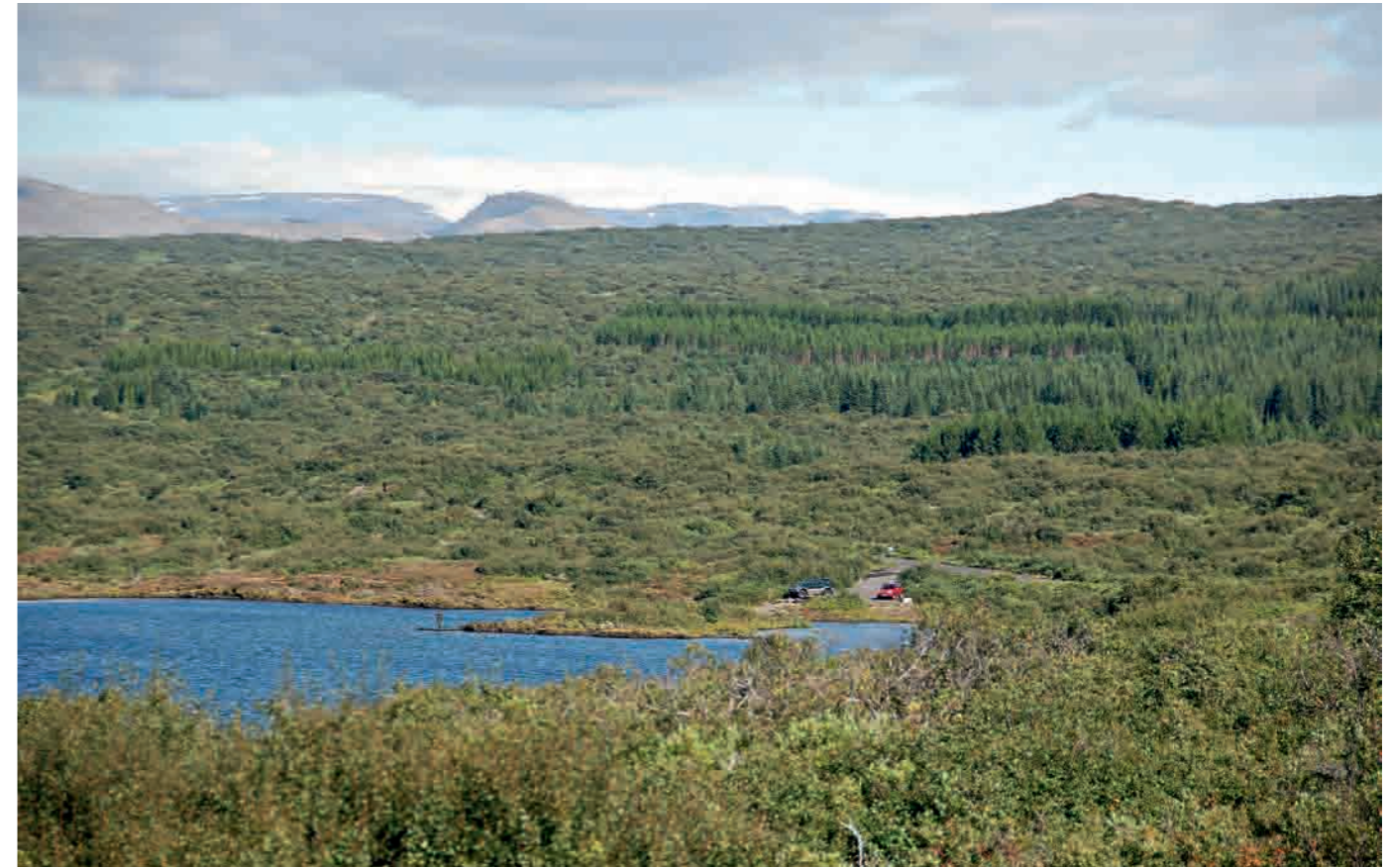
8. Area boscosa nel Parco Nazionale Þingvellir, intorno al lago di Þingvallavatn, settembre 2012.

stimata essere di almeno 1,8 miliardi di ettari, vale a dire con una perdita netta media di 360.000 ettari l'anno» 17 . Solo nel corso del XX secolo, secondo le stime dell'Organizzazione delle Nazioni Unite e del suo programma Reducing Emissions from Deforestation and Forest Degradation (REDD), è stata distrutta la metà delle foreste e, questa volta, a livello mondiale 18 . Le conseguenze si manifestano non solo sui suoli, sul ciclo dell'acqua, sulla biodiversità e sulle emissioni di gas serra, ma anche sulla produttività delle attività economiche che diminuisce a medio o a lungo termine, sulla qualità del quadro di vita e sulla capacità di trasmettere i modi di vita tradizionali, sulla cultura, sulla memoria. Fino a dove può espandersi la radura della civilizzazione umana? L'estrema "insularità" dell'Islanda che accentua la fragilità degli equilibri ecologici, non