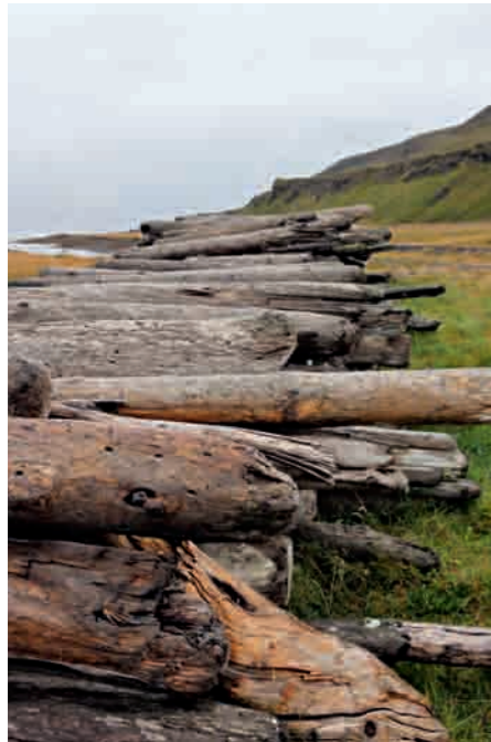
5-6. Ammucchiamenti di legna giunta galleggiando sulla riva della baia di Húnaflói, tra Hvammstangi e Hólmavík.

è probabile che l'Islanda non abbia mai conosciuto una vera foresta. Al massimo si poteva trattare di boschi, dove gli alberi, per quanto numerosi fossero, non riuscivano a superare la dimensione media, probabilmente a causa del vento che batte l'isola in tutte le stagioni 4 . Ritornando parzialmente su questo punto nella sua sintesi L'Islande médiévale , pubblicata nel 2001, il grande storico continua a mostrarsi dubbioso o quantomeno perplesso: «Che questo paese fosse ampiamente boscoso, come tramandano le leggende avvalorate dai testi antichi, anche se a un'attenta lettura appare con chiarezza l'intensità con cui ricalcano la Bibbia e la scoperta della terra di Canaan, non è impossibile, sempreché il vento, che laggiù fa da padrone, non abbia potuto favorire la crescita di grandi boschi» 5 .