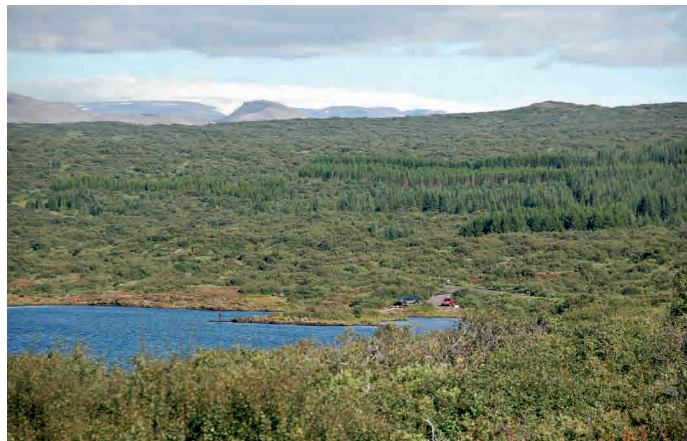
8. Area boscosa nel Parco Nazionale Þingvellir, intorno al lago di Þingvallavatn, settembre 2012.

stimata essere di almeno 1,8 miliardi di ettari, vale a dire con una perdita netta media di 360.000 ettari l'anno» 17 . Solo nel corso del XX secolo, secondo le stime dell'Organizzazione delle Nazioni Unite e del suo programma Reducing Emissions from Deforestation and Forest Degradation (REDD), è stata distrutta la metà delle foreste e, questa volta, a livello mondiale 18 . Le conseguenze si manifestano non solo sui suoli, sul ciclo dell'acqua, sulla biodiversità e sulle emissioni di gas serra, ma anche sulla produttività delle attività economiche che diminuisce a medio o a lungo termine, sulla qualità del quadro di vita e sulla capacità di trasmettere i modi di vita tradizionali, sulla cultura, sulla memoria. Fino a dove può espandersi la radura della civilizzazione umana? L'estrema "insularità" dell'Islanda che accentua la fragilità degli equilibri ecologici, non