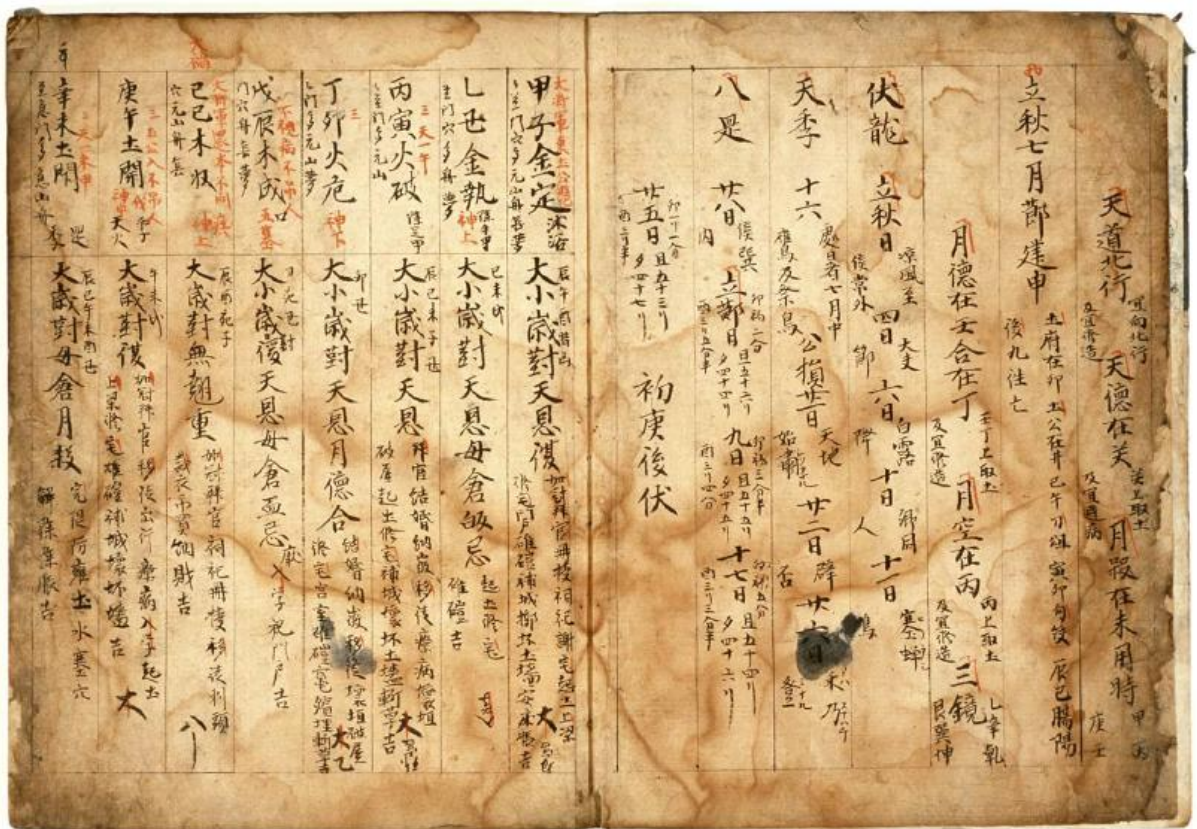
Extrait du Da Tang yinyang shu , registre du septième mois (à droite) et registres journaliers (à gauche), Bibliothèque de l'Université de Kyoto, 子 VII 6 3-1

présentent les paramètres mensuels (les périodes solaires, les esprits mensuels, etc.) et, en fonction des soixante binômes sexagésimaux possibles des jours du mois, les marqueurs des jours (sons induits, marqueurs jianchu ), les esprits journaliers (conjonction yinyang des soixante binômes yinyang daxiao hui 陰陽大小會, esprits Tian'en 天恩, Fu 復, Mucang 母倉, Guiji 歸忌...), et les activités journalières prescrites. Pour le Moyen âge chinois, un seul de ces lizhu a été conservé au Japon. Intitulé Da Tang yinyang shu 大唐陰陽書, avec en sous titre «Kaiyuan Dayan lizhu» 開元大衍曆注 (Annotations du calendrier Dayan de l'ère Kaiyuan), bien que copié en 848 par un spécialiste japonais du Onmyodô 陰陽道, il ne fait pas de doute que c'est probablement ce type de manuels dont devaient disposer les calendéristes de Dunhuang et d'ailleurs pour mener à bien leur tâche (voir fig. 1).