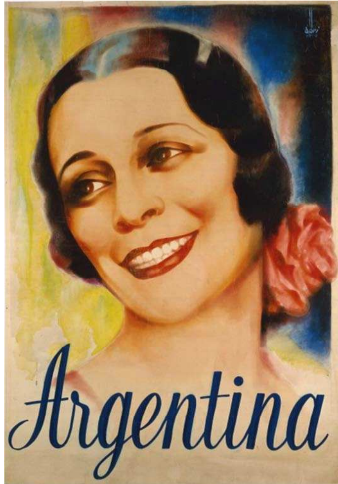
Antonia Mercé llamada "La Argentina" Cartel siglo XX Département des arts du spectacle y Bibliothèque du Musée de l'Opéra