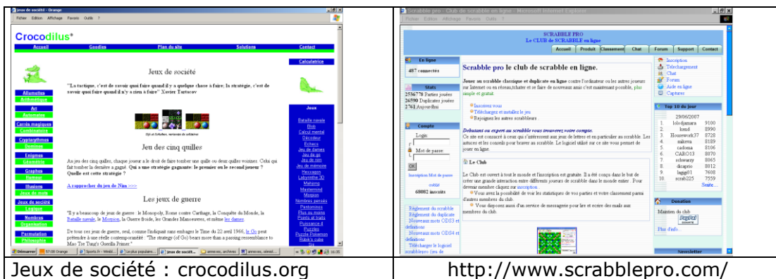
Sites à la stratégie pratique, 2007

Conformément à cette logique « d'efficacité », ces sites choisissent de s'appuyer essentiellement sur du texte, une argumentation écrite, chiffrée, mesurable, donc vraisemblable (principe, dictionnaire, règles, compétition, aide en ligne). À cette masse d'informations amassées en Une, s'ajoutent une multiplicité de liens qui se présentent comme autant de promesses d'un site riche en possibilités [ crocodillus.org ]. Ils misent autant sur une richesse informative que sur une argumentation imagée, métaphorique. L'obligation – supposée – de donner d'emblée des explications concrètes à l'internaute trouve ici une illustration d'autant plus marquante qu'il s'agit de jouer, de prendre du plaisir, de s'évader