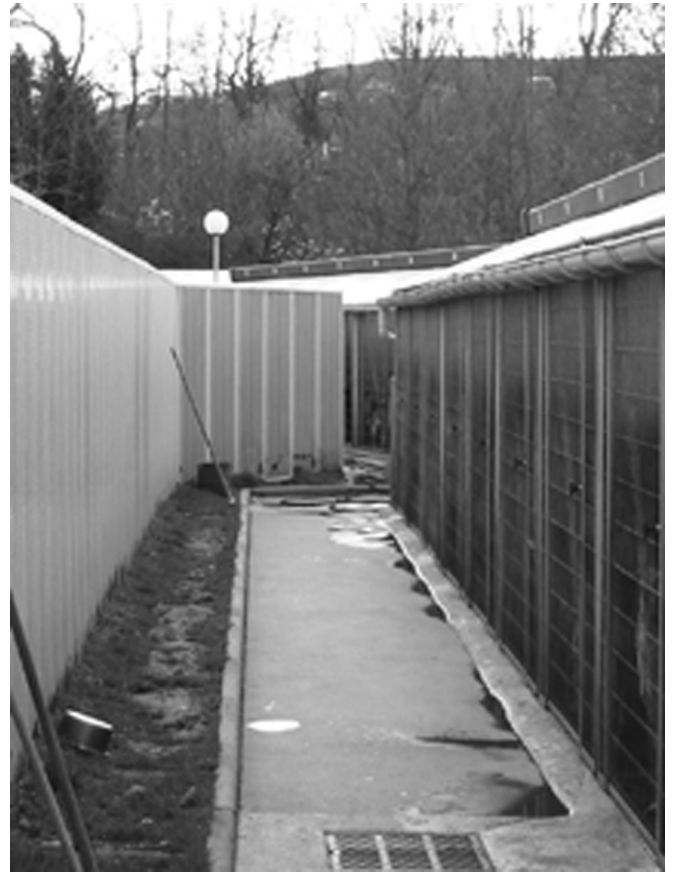
Figure 2 : Vue des boxes depuis l'espace d'accueil de la SPA (J. Michalon)

regards, à la fois côté rue à cause des haies, mais aussi à l'intérieur de l'enceinte puisque la configuration de l'espace est telle que les visiteurs de la SPA, s'ils passent furtivement pour aller du bureau d'accueil (2) aux boxes des chiens de la SPA (7 et 8), peuvent ne pas remarquer la présence du bâtiment de la fourrière, à l'écart du bâtiment « associatif ». Entre SPA et Fourrière, il y a une ségrégation des espaces extrêmement visible et affirmée. J'ai eu peu accès à cette zone. Le public y est généralement interdit. Le bureau d'accueil de la fourrière (4) contraste notablement avec celui de la SPA : le ton y est neutre, la décoration quasi inexistante, et les objets ont tous une utilité pratique. L'ambiance administrative est au rendez-vous : la fourrière dépend de la Police Municipale et ses membres sont donc des agents. Juxtaposé à ce bureau, on trouve l'infirmerie partagée par la fourrière et la SPA (3). Son décor est totalement celui qu'on peut attendre d'un tel endroit : le blanc des laboratoires s'étale sur le sol, les murs, les meubles. La grande table métallique destinée aux soins des animaux trône au centre de