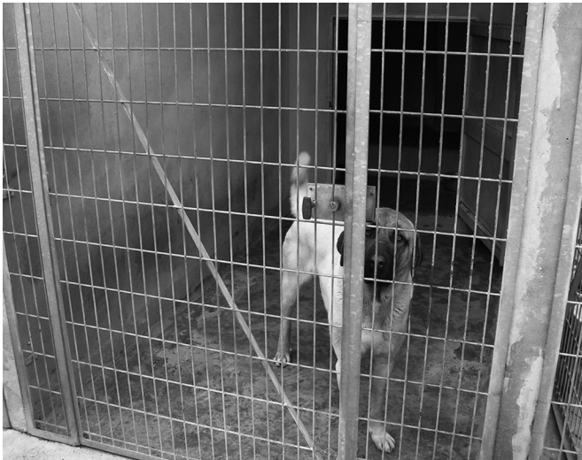
Figure 3 : Box occupé, vu de face (J. Michalon)

la pièce à proximité d'un grand congélateur où sont entreposés les cadavres attendant d'être emportés à l'équarrissage. Lieu du soin, l'infirmerie est aussi celui de la mort médicalisée des animaux, puisque l'on y pratique les euthanasies.