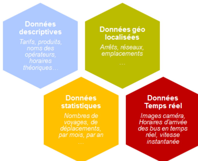
Figure 1 : une segmentation des données en 4 catégories

Le classement des données réalisé dans l'étude présentée dans cet article a abouti à une segmentation en 4 catégories différentes. Il y a d'abord les données d'informations descriptives des réseaux : prix, produits, horaires théoriques. Il y a également les données de type géographique : emplacements géocodés, cartes des réseaux, places de parking .... Puis il est possible de recenser des données de type statistique telles que le nombre de voyages, le nombre d'entrants par station. Enfin, on recense des données en temps réel mises à disposition par flux avant tout traitement statistique.