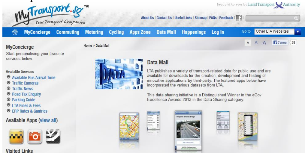
Figure 5 : intégration d'applications au site open data de l'Autorité Organisatrice (LTA, Singapour)