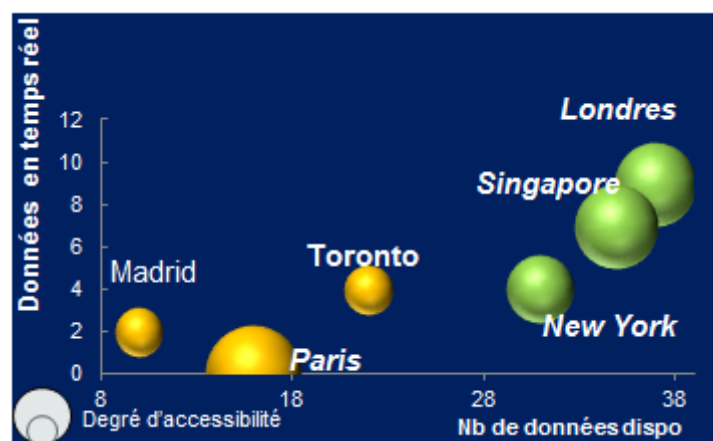
Figure 2 : classement des villes en open data