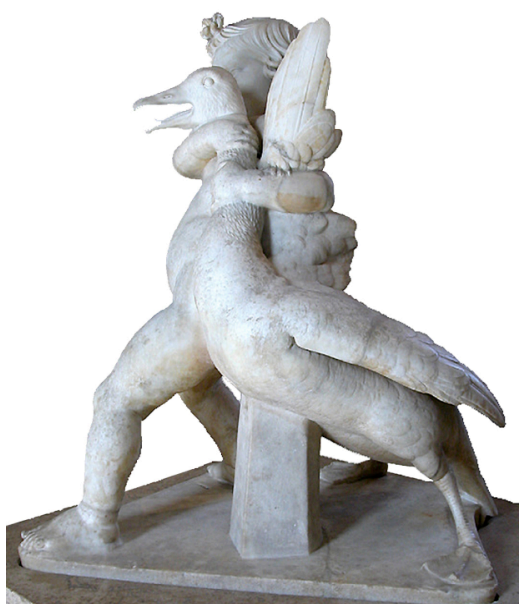
Fig. 1. Enfant étouffant l'oie (Louvre MR 168 / Ma 40).

La démarche adoptée, sans être tributaire d'un comparatisme absolu, a comme point de départ un type de pratiques sociales diversement observées en Europe dès l'époque médiévale. Une démarche éprouvée lors d'une étude consacrée aux jeux de noix de la Rome antique clarifiés par des jeux de billes traditionnels pratiqués il y a encore peu de temps en Franche-Comté 5 . Le rapport est d'autant plus marqué qu'il concerne une activité populaire de type « ludique » 6 .