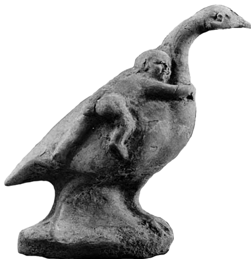
Fig. 2. Enfant essayant de maîtriser un anatidé fuyant (Louvre MN 657 / N 4529 ; III e s. av. J.-C., Cyrénaïque ; d'après http://cartelfr.louvre.fr/cartelfr/visite?srv=car_not_frame&idNotice=7372&langue=fr ).

facilement à travers les terres cuites figurant Harpocrate chevauchant une oie (réf. supra , et n. 11). Ainsi, l'image est celle d'un pais analogue à son « patron » éleveur d'enfant (τοῖς ἀνατρεφομένοις παιδίοις) 83 conduisant une oie docile car soumise, un être, précisément, à soumettre selon le sens accordé à l'enfant luttant héroïquement avec l'oie. Toujours dans cette optique, celle d'une divinité veillant à faire passer un enfant au statut d'adulte, il est logique d'orner le palmipède d'une couronne de cou florale 84 . Cette parure vectrice de philia , de relation sociale (celle promise en cas de victoire), se rencontre au cou de l'enfant lutteur qui peut être, à l'occasion, couronné de fleurs 85 . Il est tout aussi logique de doter l'enfant-dieu de l'emblème d'une autre divinité courotrophe, la massue d'Héraclès, le dieu-héros présidant à l'entraînement physique au sein des palestres, des gymnases et qui plus est dompteur d'animaux par excellence 86 .