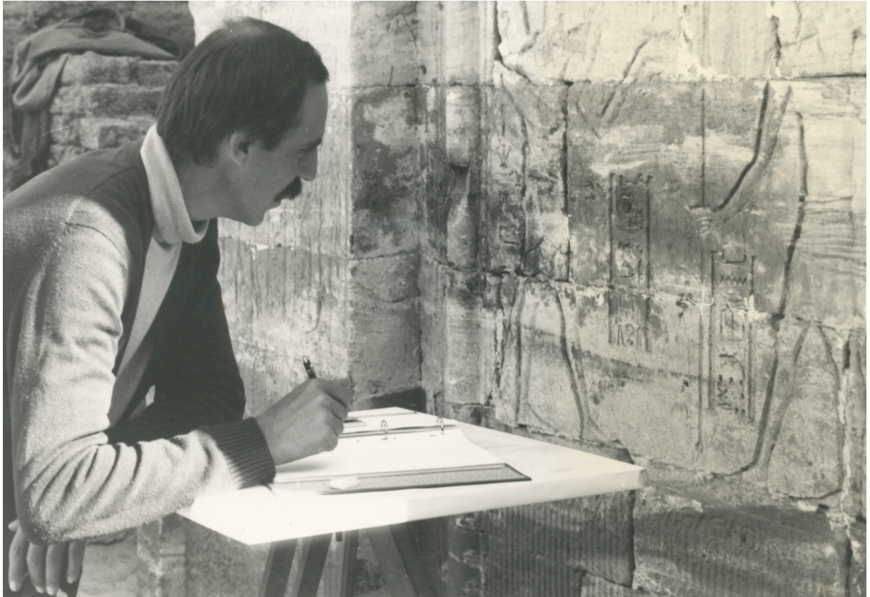
À Tôd, en 1974.