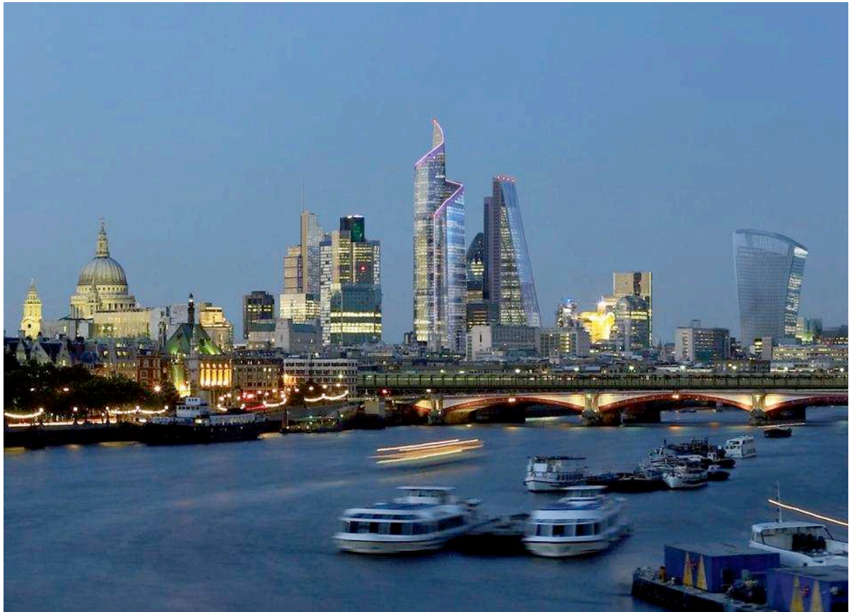
Figure 3 – Photomontage du skyline de la City de Londres avec la tour Pinnacle

De ce fait, les transformations de la gouvernance que Londres a connues ont surtout été réalisées par et pour un petit groupe d'acteurs publics et privés, aliénant les sujets ordinaires (Debarbieux, 2007). Cela concerne à la fois ceux qui édictent les normes dominantes, et, plus directement, les acteurs économiques dont dépendent en partie les promoteurs et urbanistes municipaux dans le contexte d'un aménagement négocié public-privé (Imrie et al., 2008) : promoteurs, investisseurs (REIT) et architectes. De plus, l'aménagement n'est ni autonome ni purement local. De fait, puisque les promoteurs et investisseurs britanniques sont loin de suffire à créer ce nouveau skyline, de nouvelles formes de gouvernance et des solutions architecturales standardisées sont mises en place pour attirer le capital global.