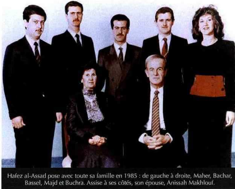
Hafez al-Assad pose avec toute sa famille en 1985 : de gauche à droite, Maher, Bachar, Bassel, Majd et Buchra. Assise à ses côtés, son épouse, Anissah Makhoul.

de soutien aux pays de la ligne de front face à Israël. Ainsi, de 1973 à 1986, la Syrie reçoit une aide annuelle comprise entre 500 millions et 2 milliards de dollars, soit plus du quart de son PIB, des pays arabes pétroliers et cumule plus de 10 milliards de dollars de dettes à l'égard de l'Union soviétique. Lorsqu'en 1985-1986 les pétromonarchies du Golfe cessent d'aider la Syrie et que l'URSS en faillite exige le remboursement de