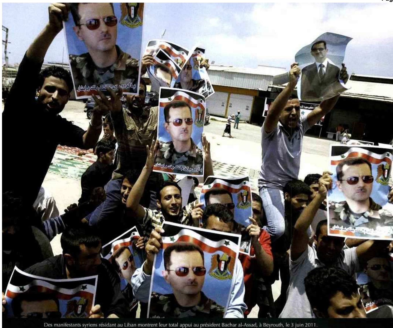
Des manifestants syriens résidant au Liban montrent leur total appui au président Bashar al-Assad, à Beyrouth, le 3 juin 2011.