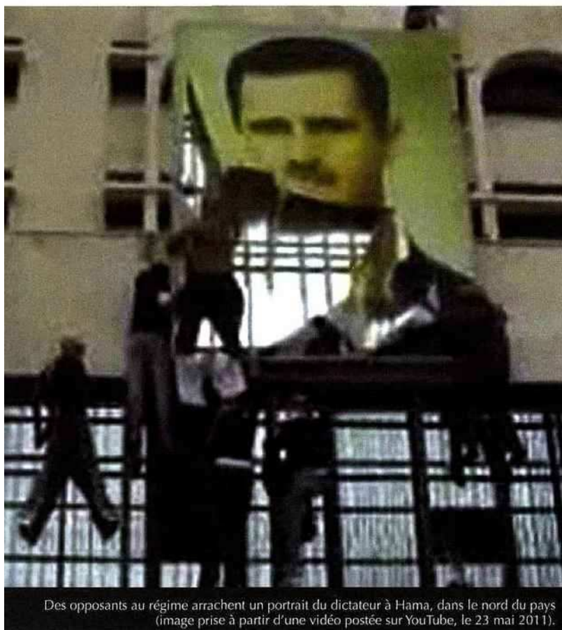
Des opposants au régime arrachent un portrait du dictateur à Hama, dans le nord du pays (image prise à partir d'une vidéo postée sur YouTube, le 23 mai 2011).

facteurs rationnels de localisation pour les entreprises dans les pays développés sont marginaux en Syrie en raison de la prégnance des rapports de pouvoir sur les rapports d'efficacité. Dans ces conditions, la réactivation du secteur privé ne profite qu'aux villes possédant une forte tradition entrepreneuriale : Damas, Homs, Hama, Alep et Lattaquié. La fonction portuaire est un atout pour Lattaquié, mais il ne faut pas en exagérer la portée, car elle est contrebalancée par le poids de la famille Al-Assad qui sclérose l'économie locale. Quant à Tartus, ville également portuaire, en l'absence d'un milieu entrepreneurial de niveau national, elle ne demeure qu'une synapse au service des métropoles de l'intérieur.