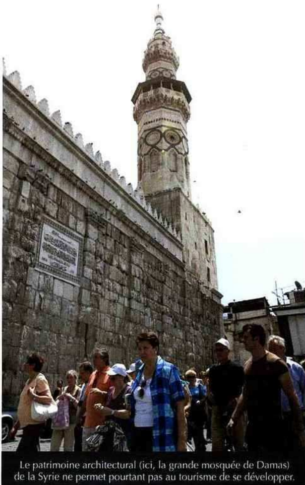
Le patrimoine architectural (ici, la grande mosquée de Damas) de la Syrie ne permet pourtant pas au tourisme de se développer.

Selon le Bureau de l'investissement syrien, Damas concentre la moitié des investissements privés du pays, contre un cinquième pour Alep. De nombreuses zones industrielles formelles et informelles ceinturent la ville et profitent de la main-d'œuvre bon marché des quartiers périphériques, encourageant de la sorte leur développement. L'ouverture économique de la Syrie, inaugurée en 1991 avec la loi n° 10, censée favoriser les investissements étrangers, a profité pleinement à la capitale syrienne. La bourgeoisie damascène, bridée pendant trente ans par le régime baasiste, a immédiatement saisi les opportunités du nouveau contexte économique et de sa proximité géographique avec les autorités centrales. Le marché syrien a attiré quelques entreprises étrangères, en particulier dans l'agroalimentaire (Nestlé en 1992 et les fromageries Bel en 2003) et la construction (les cimenteries Lafarge en 2008). Cependant, les conditions d'investissement, la rigueur du système d'embauche, héritée de la période socialiste, la quasi-obligation de prendre un représentant syrien proche du pouvoir et la corruption ambiante découragent les investisseurs. Les projets immobiliers sont nombreux, mais ils tardent à être réalisés en raison des conditions sévères que les autorités veulent imposer aux investisseurs potentiels. Le chantier des friches ferroviaires de la gare du Hedjaz est stoppé depuis 2003, la société