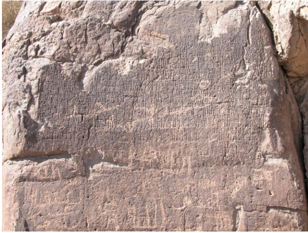
Pl. 1. L'inscription Quşayr 1