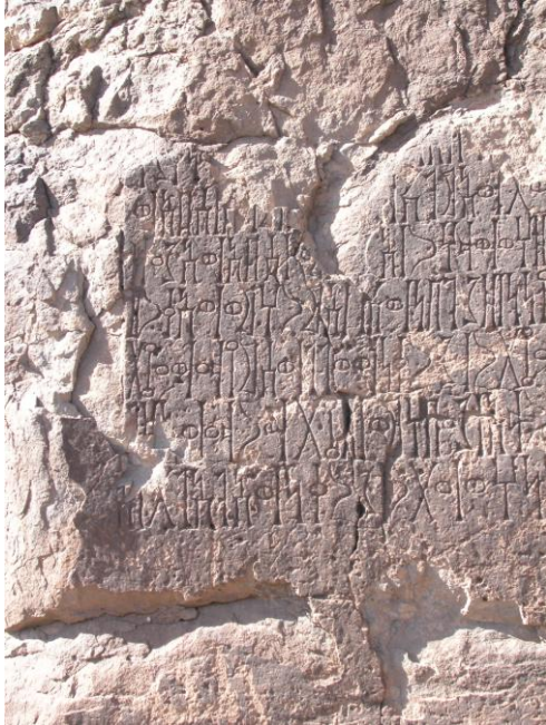
Pl. 4. L'inscription Quşayr I (detail)