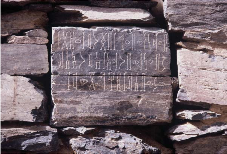
Fig. 6 : l'inscription MAFRAY-Hajar Warrāṣ 2.

“... .. avec l'aide de ..., de dhāt-|Ba'dān, du Maître de Bs 3r m et de dhāt |Shab'ān, et avec l'aide de leurs seigneurs | et de leur commune dhū- Hlz w m ”