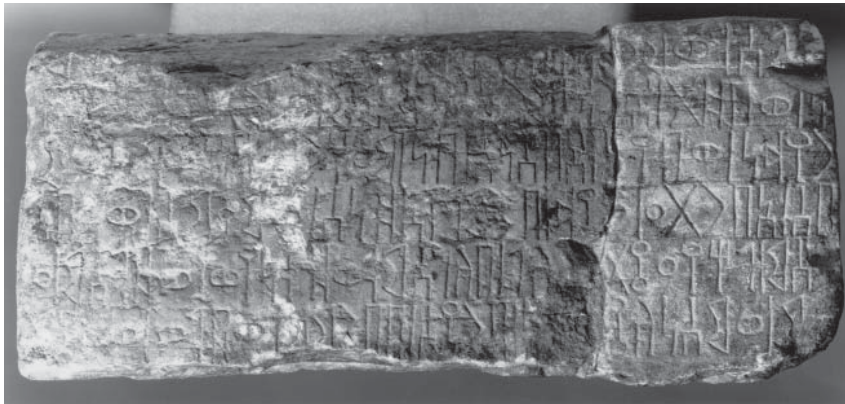
Fig. 4 : l'inscription RÉŠ 4336 (Vienne, Hofmuseum), paroi B (en avant).