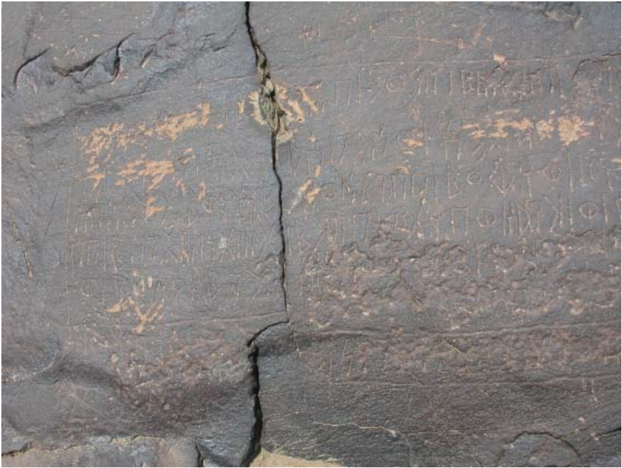
Fig. 2 : l'inscription MQ-dhū Nā'im 1 (détail).

Hs 3 gb m : nom propre, apparemment un nom d'homme, dont c'est la première attestation.