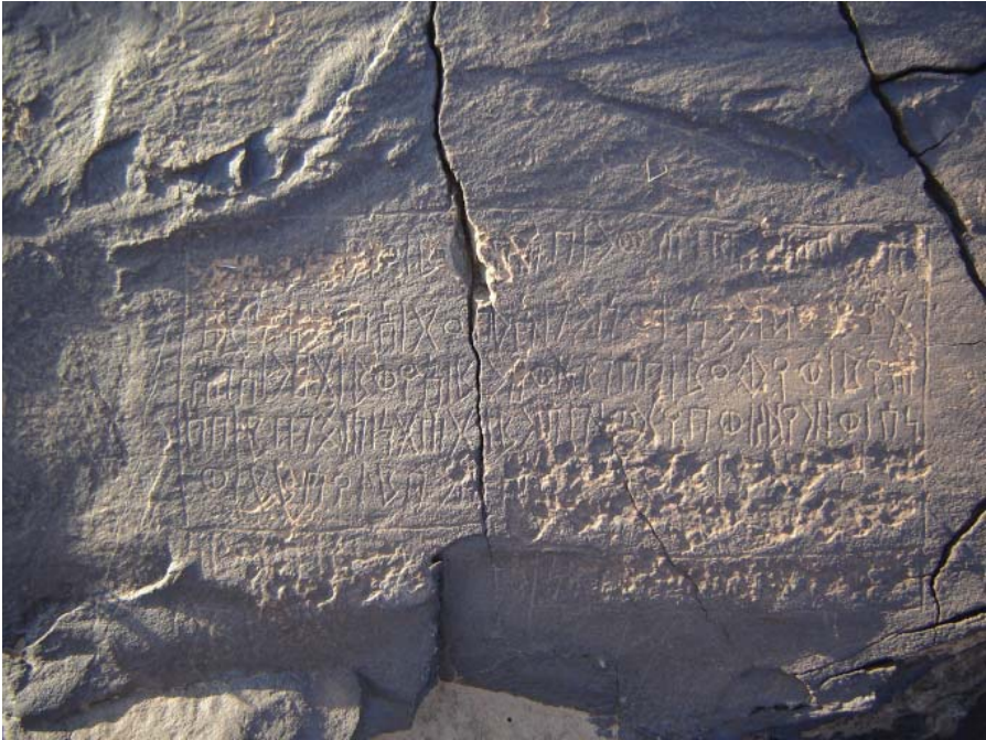
Fig. 1 : L'inscription MQ-dhū Nā'im 1.

La graphie implique une date antérieure au début de l'ère chrétienne : noter le w circulaire, le f en losange, le r anguleux et la raideur des caractères. Comme toujours, il est difficile de donner une estimation très précise, mais, si on se fonde sur l'allure générale de la graphie et sur des indices tels que la taille différente du wāw et du ʿayn , on peut dater ce document du 1 er siècle avant l'ère chrétienne et même, avec une certaine vraisemblance, de la seconde moitié de ce siècle.