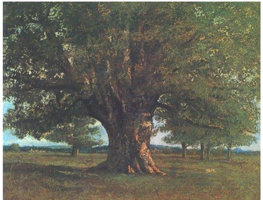
Gustave Courbet, Le Chêne de Flagey (dit « Le Chêne de Vercingétorix »), 1867, collection privée, Japon, tous droits réservés