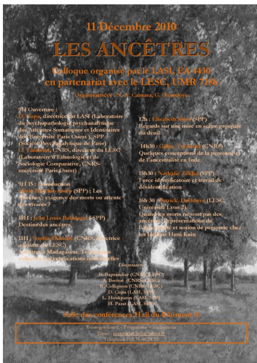
Affiche pour le colloque « Les Ancêtres »

Une brève discussion préliminaire peut permettre d'illustrer la prudence de l'ethnologue face aux images « spontanées » que pourrait sembler évoquer la notion d'ancêtres. L'affiche du colloque à l'origine du présent ouvrage présentait un arbre aux ramifications nombreuses, au fût vertical élevé, image qui peut en effet, dans le monde occidental, évoquer l'ancestralité. On y reconnaît le chêne peint par Gustave Courbet, auquel une anamorphose, suggérée sans doute par le format vertical de l'affiche, a fait perdre de l'embonpoint au profit d'une élévation plus marquée. Coïncidence heureuse, ce tableau est aussi couramment appelé « Le Chêne de Vercingétorix », pointant vers une ancestralité carrément nationale.