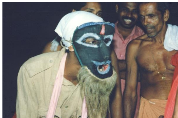
Masque d'Appuppan. Irinjalakkuda.

La figuration qui est donnée lors de cette possession peut varier. Elle est proche de celle des Bhutas, fantômes et divinités subordonnées, souvent assimilés à des êtres de la forêt ou de la sauvagerie, et dont certains sont honorés comme figures ancestrales d'une lignée. L'ancêtre apparaît alors comme partie prenante de la hiérarchie du monde divin, comme figure proche des humains mais aux pouvoirs ambivalents, à la fois dangereux et protecteurs.