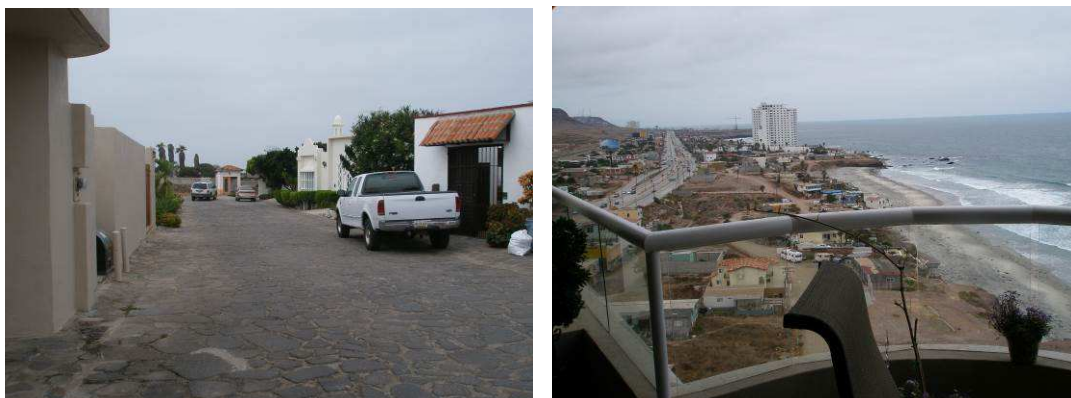
Fotografías 1 y 2. Tipos de vivienda de los jubilados

Uno de los mayores impactos económicos se produce a consecuencia de la adquisición de la vivienda. Existen distintos tipos de residencia, pero lo más habitual entre los jubilados es la urbanización en horizontal, más que en vertical, predominando así la vivienda individual y unifamiliar, localizada normalmente en grandes urbanizaciones en primera línea de costa, con vigilancia privada constante, y en zonas relativamente alejadas del centro urbano (Fotografía 1); el segundo tipo de vivienda elegida con más frecuencia por los entrevistados es el condominio, que equivale a un “piso” en edificios de varias plantas (Fotografía 2).