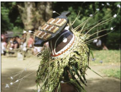
Headdress from the mag dance, in the shape of a cooked dish (Jölap, Gaua)

The second dance, quite similar, is called qat (pronounced [kpwat]) – or more precisely: qat in Mota, Dorig and Lakon, qet in Vurès, neqet in Mwotlap and in Mwerlap. This name is historically linked with the name of Qat or Qet, the divinity of origins (François 2013). Just like the mag , the qat is for male initiates only, but from a higher grade.