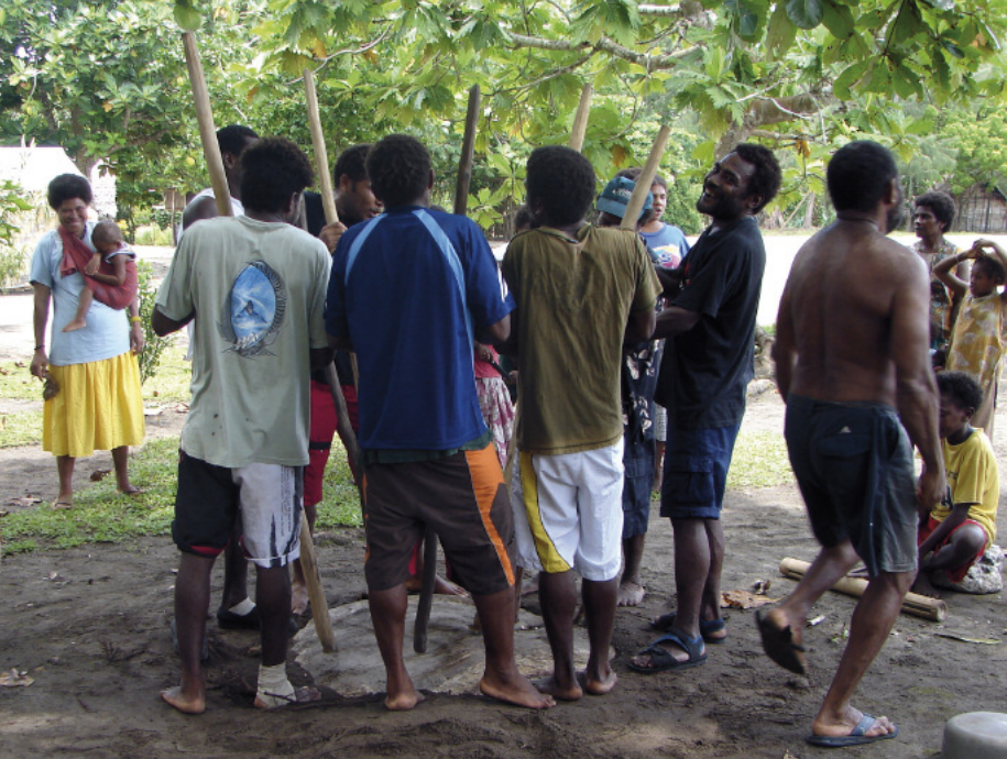
Une fête newët / A newët party (Yaqane, Hiw)