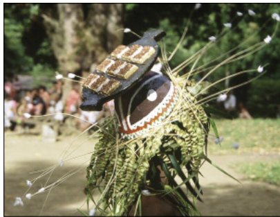
Coiffe de la danse mag , en forme de plat cuisiné (Jölav, Gaua)

Musicalement, le qat tout comme le mag ne mettent en jeu que deux instruments : le petit tambour à fente – joué par un musicien debout au centre de la place – et les sonnailles aux chevilles des danseurs.