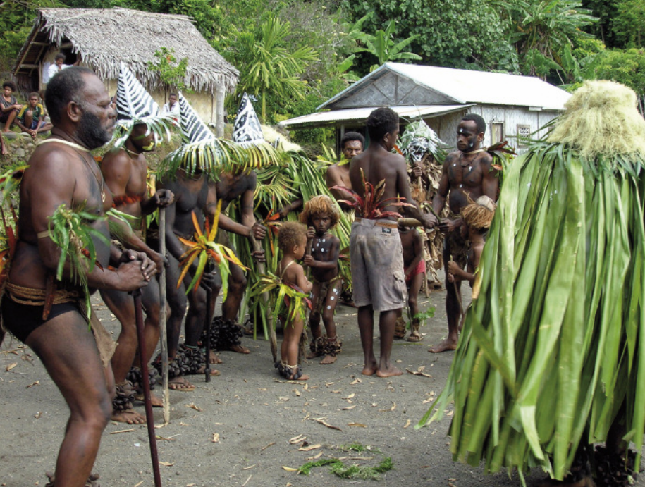
Uttag, danse des initiés / dance of initiated men (Merelava)