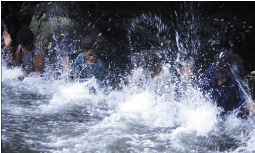
Water games in the river (Qtevut, Gaua)

the water, “slap” it ( wes ), or “smack it sharply” ( vuh tēqēl ). A light sound may be produced by putting just two fingers into the water ( gisgis ) and a heavy sound by suddenly plunging both fists ( wej ). The leader’s signal ( puow ) indicates a sequence is about to finish. A sequence may be played twice: the first time together, and the second in two staggered groups – like a canon – resulting in a two-part polyrhythm: this is the case for sequences 2 and 3 in the recording.