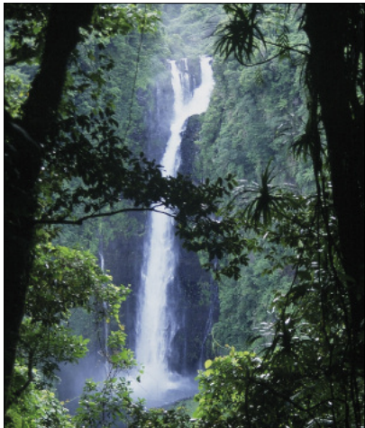
The great waterfall of Gaua