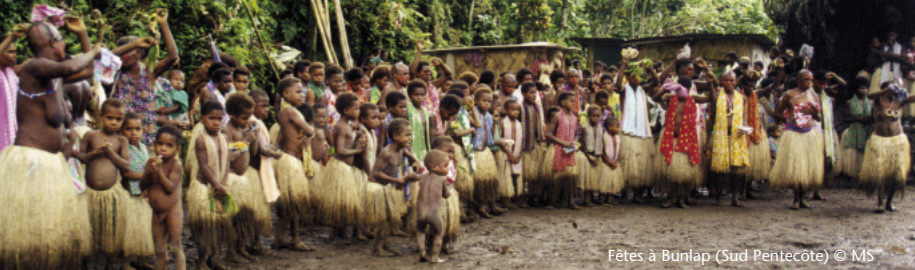
Fêtes à Bunlap (Sud Pentecôte)

Ce contraste entre musiques “locales” et musiques ressenties comme exogènes peut surprendre, lorsque l’on connaît la circulation constante des formes musicales entre communautés, qui souvent voyagent d’une île à l’autre de l’archipel. En d’autres termes, les musiques “d’ici”, que l’on assigne à la “coutume”, sont souvent déjà des musiques d’ailleurs, arrivées un jour par la mer. Malgré cela, un contraste subsiste dans les perceptions, entre une musique de la “coutume” et des formes qui n’y appartiendront jamais vraiment ( string band , chants d’église). Il est possible qu’un élément clef puisse expliquer cette dichotomie entre ces deux catégories de musique : la capacité des insulaires à en maîtriser toute la chaîne de production.