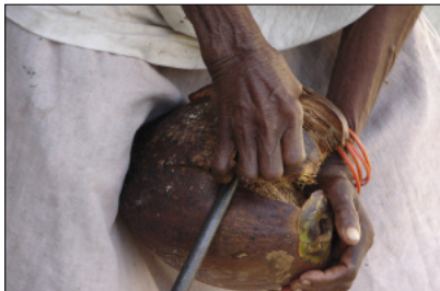
Coconut husking

The poem has two levels of reading. At first sight, this is an innocent physical competi-