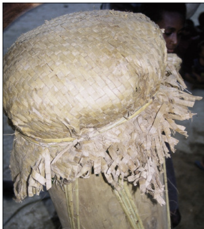
Tambour à membrane natmat-woh (Motalava)

D'une part, sur l'île de Maewo, un tambour à membrane existe encore, mais sa fabrication n'est connue que de quelques individus. Ce tambour se nomme tağura , c'est-à-dire "sagoutier", du nom du bois dans lequel il est fabriqué. Instrument tabou, il est utilisé lors d'une cérémonie exceptionnelle, Ġwatu ta Baruğū , à l'issue de laquelle il doit être détruit. Le nord des îles Banks possède également un tambour à membrane fabriqué dans un sagoutier. Après avoir évidé le tronc de sa pulpe, on obtient un fût d'environ 1,40 m de long et 40 cm de diamètre. On en recouvre