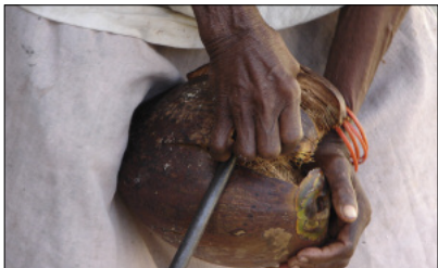
L’écorçage de noix de coco

[ En écorçant les cocos, chant titi, Vanua Lava ]