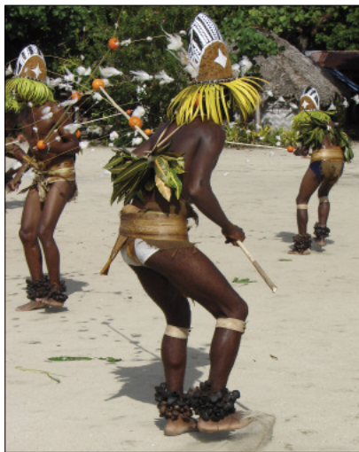
Sonnailles de chevilles dans la danse neget (Lahlal, Motalava)

Connues dans tout l'archipel du Vanuatu et au-delà, les sonnailles sont fabriquées à partir des fruits d'un végétal, Pangium edule , sorte de noix dont les coques sont vidées puis séchées au soleil, avant d'être tressées en grappes. La particularité de cet instrument est d'être normalement joué non par les musiciens, mais par les danseurs : les sonnailles sont attachées à leurs chevilles, et s'entrecho-