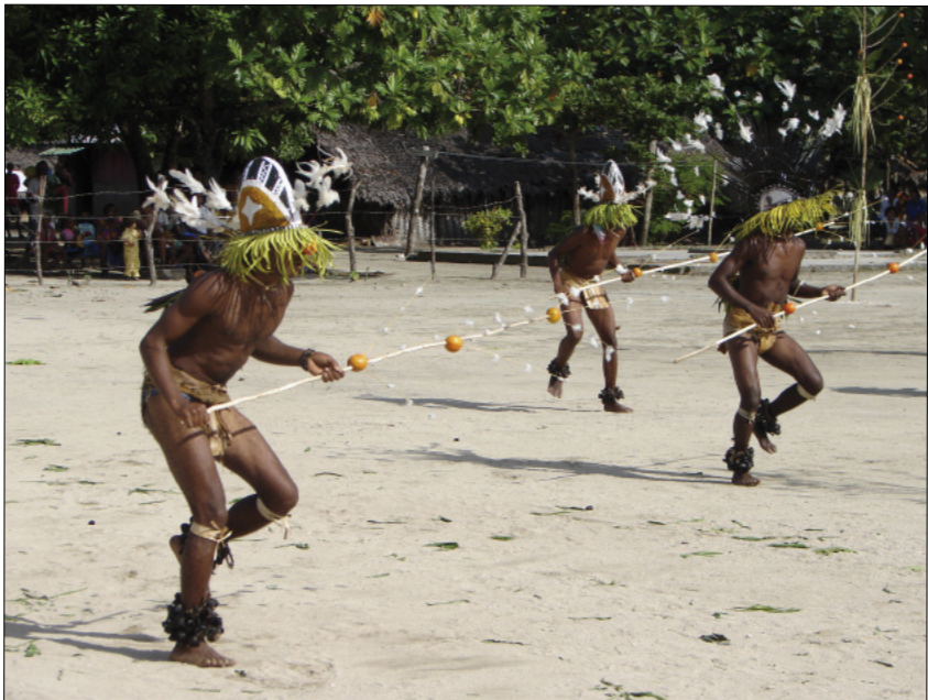
Dance of the spirits, the neqet (Lahlap, Motalava)

only be sung silently by the dancers, in their heart of hearts. The only sounds heard are not articulated words, but some form of shouts – either signals thrown by the key drummer (“ Hiy sito! ”), or the growling of the ancestors themselves.