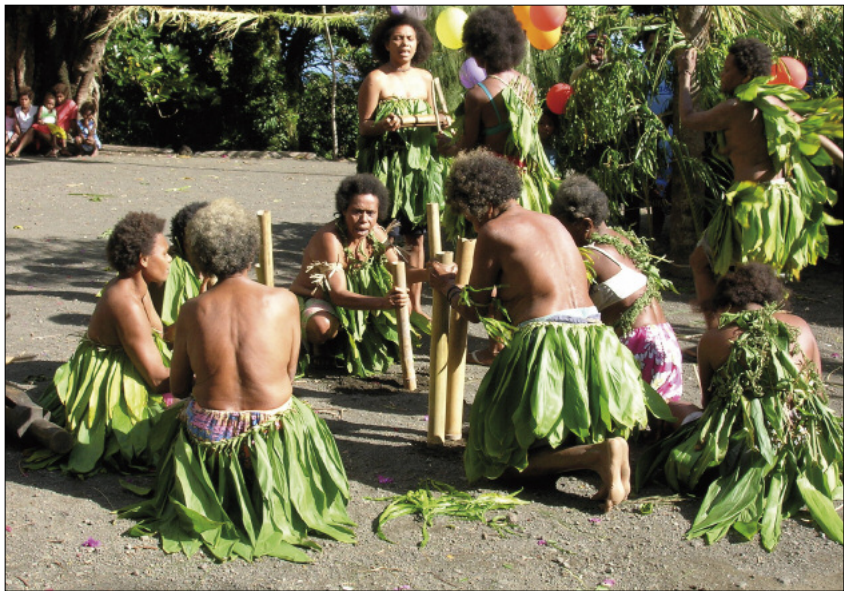
Stamping tubes for nombo dance (Merelava)

called nombo (“bamboo” in the local language). Six women, squatting or sitting in a circle, hold a short bamboo tube in each hand [photo], and strike the ground while they sing [©11]. Another type exists in Pentecost. Longer, and played in larger numbers than in Merelava, these bamboos