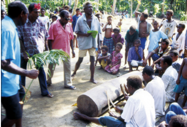
Singers and drummers around the wooden slit gong nakoy (Avay, Motalava)

be heard in the recording: the main song (“E ale...”); the joyful cries of the dancers; a fast-tempo, continuous beat (called beleg in Mwotlap) played with fine wooden sticks by the two percussionists seated on both ends of the drum; finally, a discontinuous, more muffled rhythm ( bōl ) beaten by the main drummer, the one who is seated facing the middle of the instrument.