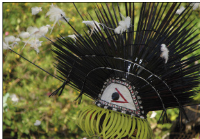
The spirit of the Urchin, neqet dance (Lahlap, Motalava)

One context in which music also formalises the bond between the living and the dead is that of secret societies (Vienne 1984, 1996). Boys of a same age group gather together, somewhere in the forest, under the aegis of a protective divinity, and learn from their elders a number of songs, dances and instruments reserved to the initiated. At the end of this period of reclusion, these