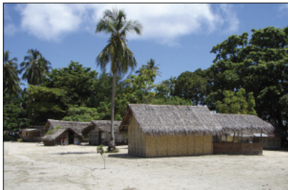
Un village côtier (Yugemène, Hiw, Torres)

Ce livret propose d'accompagner le lecteur dans ce voyage musical. Après avoir évoqué la place de la musique dans les sociétés du Vanuatu, nous présenterons leurs instruments de musique et décréterons l'art de la poésie chantée. Enfin, l'auditeur pourra suivre le déroulé de l'album et le détail des 41 pièces à la découverte de l'univers musical de l'archipel.