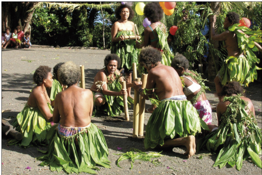
Bambous pilonnants dans la danse nombo (Merelava)