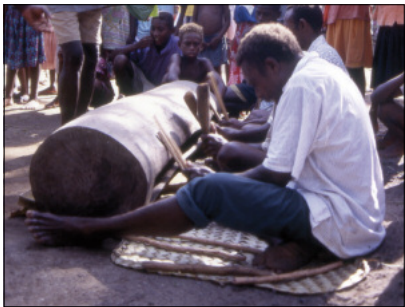
Slit gong nokoy (Motalava)

of Motalava, tēn in Lakon); the two drummers each side of him play with hard, lightweight sticks, producing a higher and more powerful sound ( beleg in Mwotlap, vuh in Lakon). The pattern is thus polyrhythmic, with each musician striking a different ostinato.