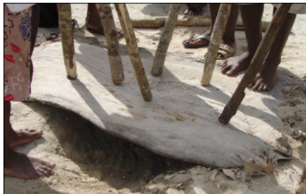
The percussion board iyit rēre (Hiw, Torres)

In the Banks Islands, the percussion board is the central piece of musical moments – quite literally in fact, since it is placed in the middle of the village clearing, and forms the central point around which the circles of musicians and dancers evolve. A key element