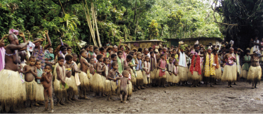
Women and children during festivities in Bunlap (South Pentecost)

A key element could possibly explain this dichotomy between these two categories of music: namely, the islanders' capacity to control the full chain of production. Customary music – even when it circulates from one island to another, and is thus not “local” strictly speaking – will always involve instruments and techniques that can be readily reproduced from local resources; in these conditions, it is easy for the islanders to learn new styles and enrich their inherited repertoire. By contrast, music of European origin often implies the use of materials (metal, plastic...) and foreign instruments that can be harder to recreate locally.