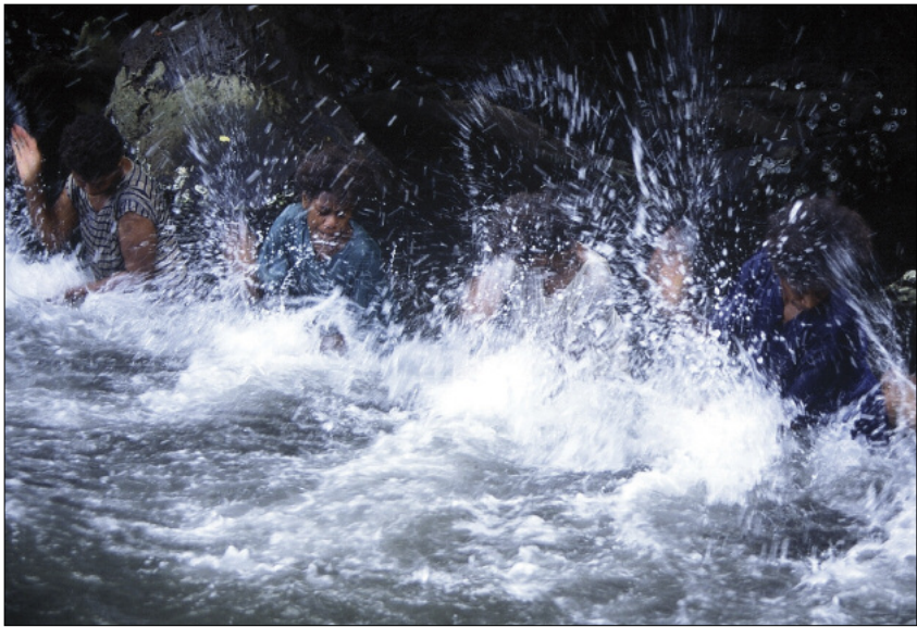
Jeux d'eau dans la rivière (Qtevt, Gaua)

main peut venir “caresser” ( hārāv ) la surface de l'eau, la “gifler” ( wes ), ou encore la “claquer d'un coup sec” ( vuh tēqēl ). On peut produire un son léger en enfonçant dans l'eau juste deux doigts ( gisgis ), ou au contraire un son sourd en y plongeant soudain ses deux poings ( wej ). Le cri ( puow ) poussé par la meneuse donne le signal qu'on arrive à la fin