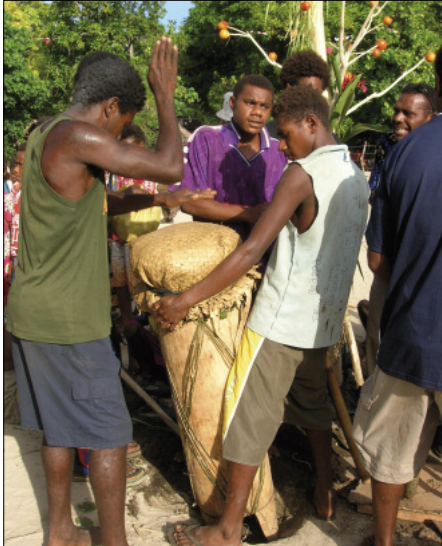
The single-headed drum during a nawha titi session (Toglag, Motalava)

In each titi piece, there is always a fleeting moment when the instruments suddenly stop ( yak in Mwothlap), before starting up again with even more fervour: this is heard at 0’56”, 1’39” and 2’35” in the song of the Rain [⊙25], at 1’26” and 2’26” in Liana flower [⊙27], at 1’04” and 2’46” in Volcano [⊙29]. This technique emphasises the group’s cohesion and strength.