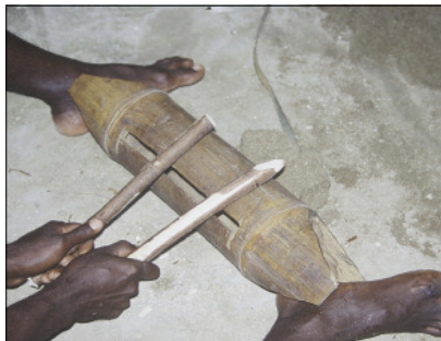
Tambour à fente en bambou (Motalava)

Dans les langues du nord du Vanuatu, ce petit tambour à fente est toujours distingué de son grand frère, le grand tambour à fente taillé dans un tronc d'arbre. Par exemple, la langue lakon (ouest Gaua) désigne le grand tambour comme kee , et le petit comme qalē laklake (littéralement "entrenœud-de-bambou à danser").