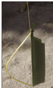
Bullroarer made out of a coconut leaf

The double rotation of the instrument – simultaneously above one’s head and on its own axis – results in a loud, deep humming sound. This recording features not just one, but three bullroarers – which together produce a truly powerful effect.