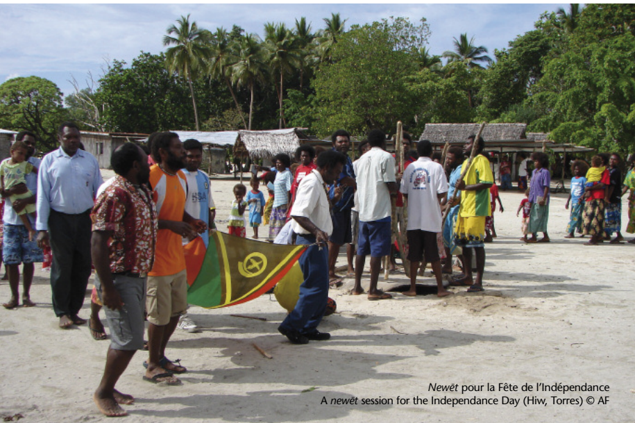
Newët pour la Fête de l'Indépendance A newët session for the Independence Day (Hiw, Torres)

espeseli ol man blong singsing mo tanis we oli sherem musik blong olgeta wetem mitufala: nem blong olgeta evriwan istap insaed long buk ia. Naenti pasent blong ol vatu we bae i kamaot long CD ia, bae i go long Vanuatu Kaljoral Senta long Vila, blong oli save bildimap ol kaljoral projek long fyuja we i save benefitim evri pipol blong TORBA, PENAMA mo narafala aelan blong Vanuatu. Tankyu tumas.