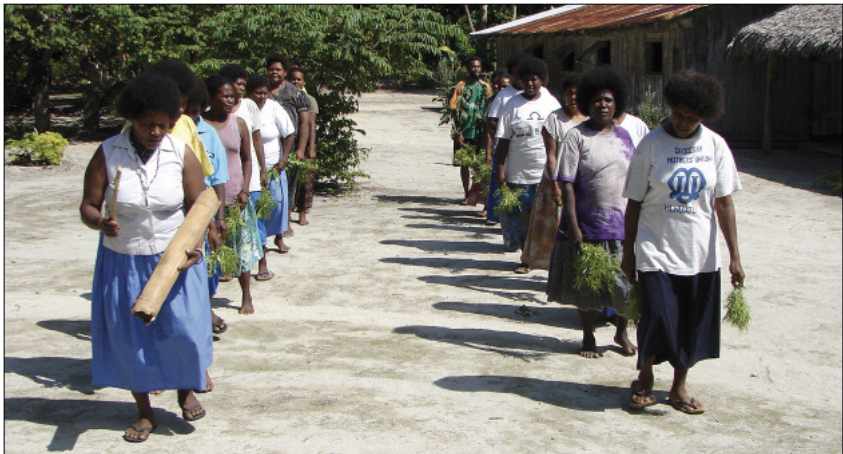
The women's dance rurumbē (Hiw, Torres)