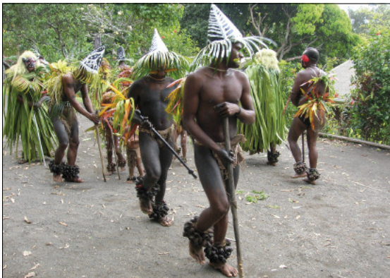
The utmag dance of initiated men (Leqal, Merelava)

voices of the dead themselves, come to haunt the living for the duration of the dance. The jerking rattles, the irregular rhythms of bamboos being struck, the sudden, unexpected silences, create a strange, spellbinding atmosphere, tinted with awe.