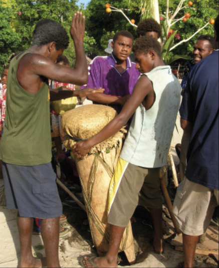
Le tambour à membrane lors d'une séance de nawha titi (Toglag, Motalava)

les autres musiciens. C'est à ce moment que l'orchestre titi donne sa pleine puissance, à travers tous ses instruments et toutes ses voix. D'ailleurs, le terme titi lui-même trouverait précisément son origine dans cette forme responsoriale – à partir d'un ancien verbe ti ou titi "répondre". Cette alternance du soliste et du chœur obéit à des schémas assez réguliers, que l'on entend bien dans le disque, et que nous analyserons dans la description des pièces.