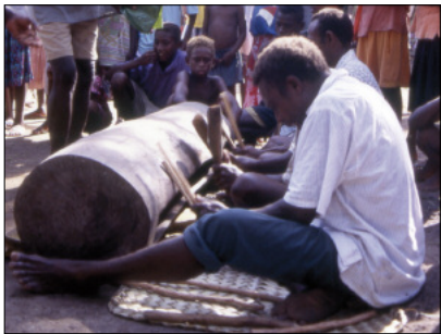
Tambour à fente nokoy (Motalava)

Dans la majeure partie de l'archipel, cet instrument sera ainsi joué dans une formation de plusieurs tambours (Crowe 1996), chacun joué par un seul musicien. Aux îles Banks en revanche, plusieurs musiciens frappent le même tambour – lequel suffit, à lui seul, à produire une polyrythmie [photo ci-contre]. Dans les îles de Motalava et de Gaua, ce lourd tronc évidé fait environ 1,40 m de long pour un diamètre de 45 cm. Posé au sol, il est joué par trois musiciens assis. Celui du milieu percute le centre du tambour à l'aide d'épais pétioles de palmes de cocotier, produisant les basses ( bōl en langue mwotlap de