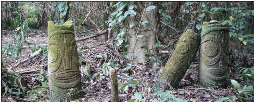
A spiritual stele dule in the forest (Toga, Torres)

The ghosts of our ancestors are never far away: they live on all around us, and guide the lives of mortals. Only the initiated have access to their universe, their secrets, their language. Some men endowed with supernatural power – shamanic healers, soothsayers, sorcerers – can even interact with