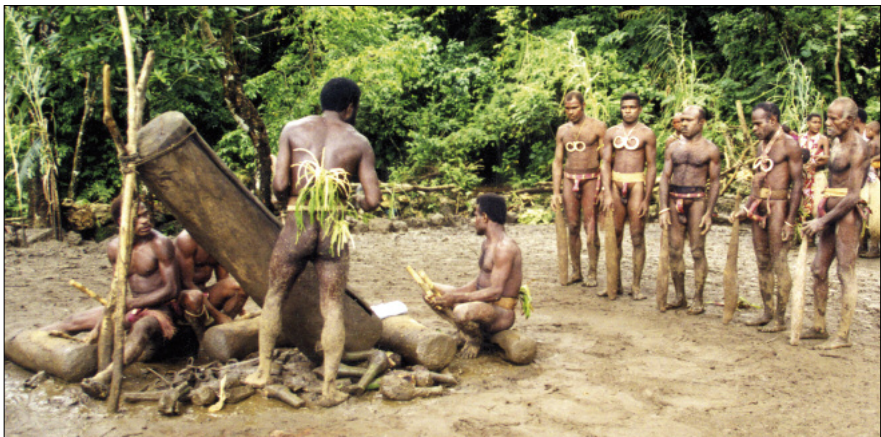
Grade-taking ceremony in Bunlap (South Pentecost)

In the islands of Pentecost, Ambae and Maewo the slit gong has preserved its original tie with graded societies, an institution still very much alive today. Among the attributes associated with certain grades are precisely certain drumming rhythms: these are always played on a group of several wooden drums of varying sizes [photo below]. In the