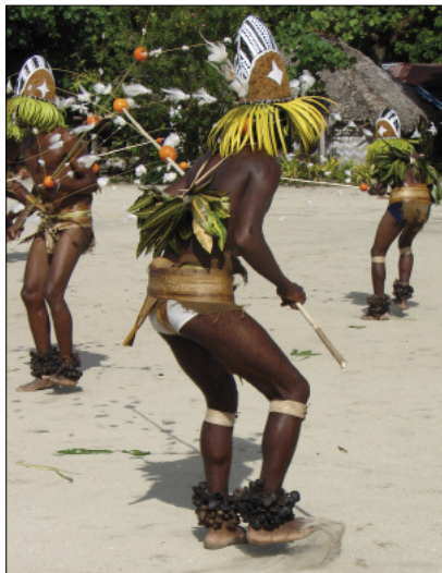
Ankle rattles for neqet dance (Lahlap, Motalava)

They are widely used in the Banks islands, especially in masked dancing performed by young initiates – whether the young men's dance called utmag in Merelava [☉36] or the spectacular neqet dance [photo] in Motalava [☉37]. In all these dances, the concussion of the dried nuts together accompanies the sharp striking of the small slit drums and the voices of the soloist singers, in a very characteristic musical soundscape.