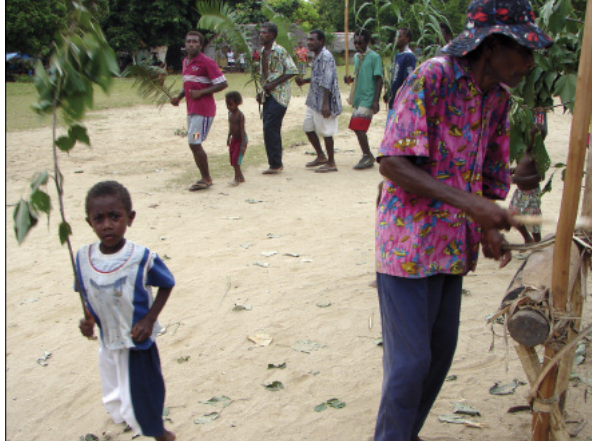
Noyongyep dances for a wedding

When the place is full of dancers, the rhythm suddenly accelerates (this is very