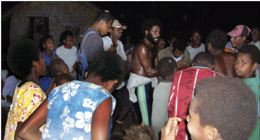
A sawagoro night session (Umulongo, Maewo)