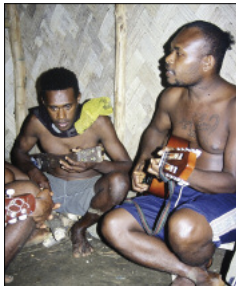
A stringband session in the village (Jölap, Gaua)

In spite of these new trends, inherited musical styles still thrive in most of the islands. In the absence of electricity, rural areas of Vanuatu seldom listen to the radio or commercial CD's. Until mobile phone technology was introduced in the late 2000's, they had remained largely cut off from urban music. In most of the archipelago's villages, three main styles are in use today: church songs; string band songs; plus everything else, grouped into a vast category referred to as “local music” or “our music” – in contrast to music from afar. In Bislama, one often speaks of kastom tanis , literally “custom dances”, or kastom singsing “custom songs”.