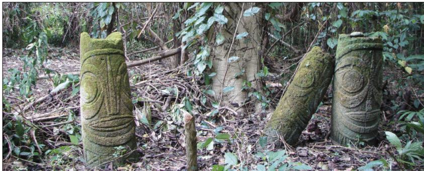
Stèles des esprits dule dans la forêt (Toga, Torres)

Les ancêtres et les morts vivent autour de nous, et nous guident dans nos vies de simples mortels. Seuls les initiés ont accès à leur monde, à leurs secrets, à leur langage. Certains hommes aux pouvoirs surnaturels – guérisseurs, devins, chamanes – peuvent même les voir dans leur monde (le Panoi ) et interagir avec eux. Ces sorciers reviennent alors dans le monde des vivants (le Marama ) pour exhiber les mystérieuses beautés qu'ils auront découvertes.