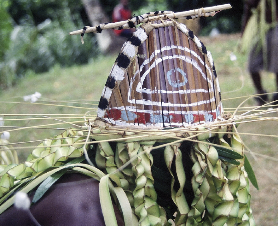
Le regard du Maraw , esprit de la danse mag / The eye of the Maraw , spirit of the mag dance (Jölap, Gaua)