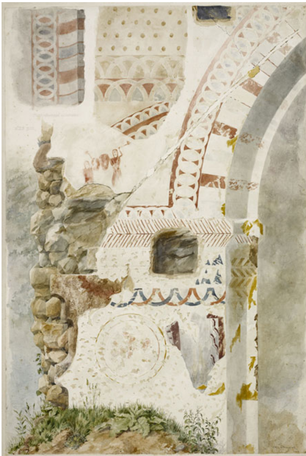
Fig. 2 - Relevé des peintures au nord de l'arc triomphal par Charles Chauvet, 1916.

a en effet permis de laisser apparaître, sous les couches de badigeons modernes, des peintures murales romanes d'une qualité et d'une originalité rares, dans une région fort dépourvue en la matière 4 . C'est la valeur de ces décors peints qui a poussé le musée des Monuments français à constituer une importante documentation sur le site au début du XX e siècle : une série de copies aquarellées, de la main du peintre Charles Chauvet (fig. 3), ainsi que quelques prises de vue sur plaque de verre 5 . On comprendra l'importance prise par cette documentation iconographique, après la disparition quasi-totale des peintures, provoquée par plus d'un siècle d'exposition aux intempéries.