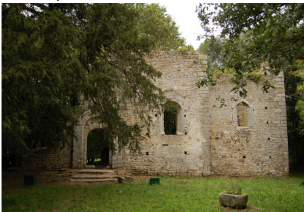
Fig. 1 - Vue de l'église depuis le sud.