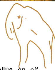
Mammouth 2, Pair non Pair, d'après B. et G. Delluc, op. cit.