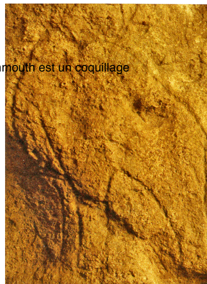
L'œil du mammouth est un coquillage

Ce serait cependant un contresens de penser que l'artiste avait l'idée de son œuvre en tête et qu'il a cherché le meilleur endroit pour la réaliser. Non, notre civilisation qui ne sait penser que selon des processus d'optimisation nous induit en erreur, il apparaît assez évident que le processus n'est justement pas une habileté à utiliser pour un objectif prédéfini, mais au contraire une lecture a priori de la tête d'un animal ou d'une autre partie de