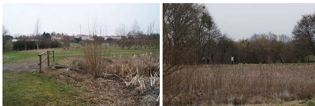
figure 4 : les bassins du chemin du Godefroy, Dardilly (Monin, 2010, p. 10)

Les entretiens concernent 14 personnes ayant participé ou participant à la conception, l'entretien ou la gestion du site : agents du Grand Lyon et des communes concernées, militants associatifs intervenant sur les lieux, élu, chercheur impliqué dans l'expérimentation (tableau 2). Ils ont été