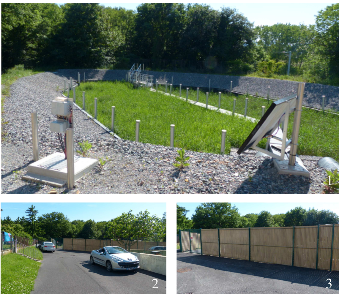
figure 8 : le prototype (2013)