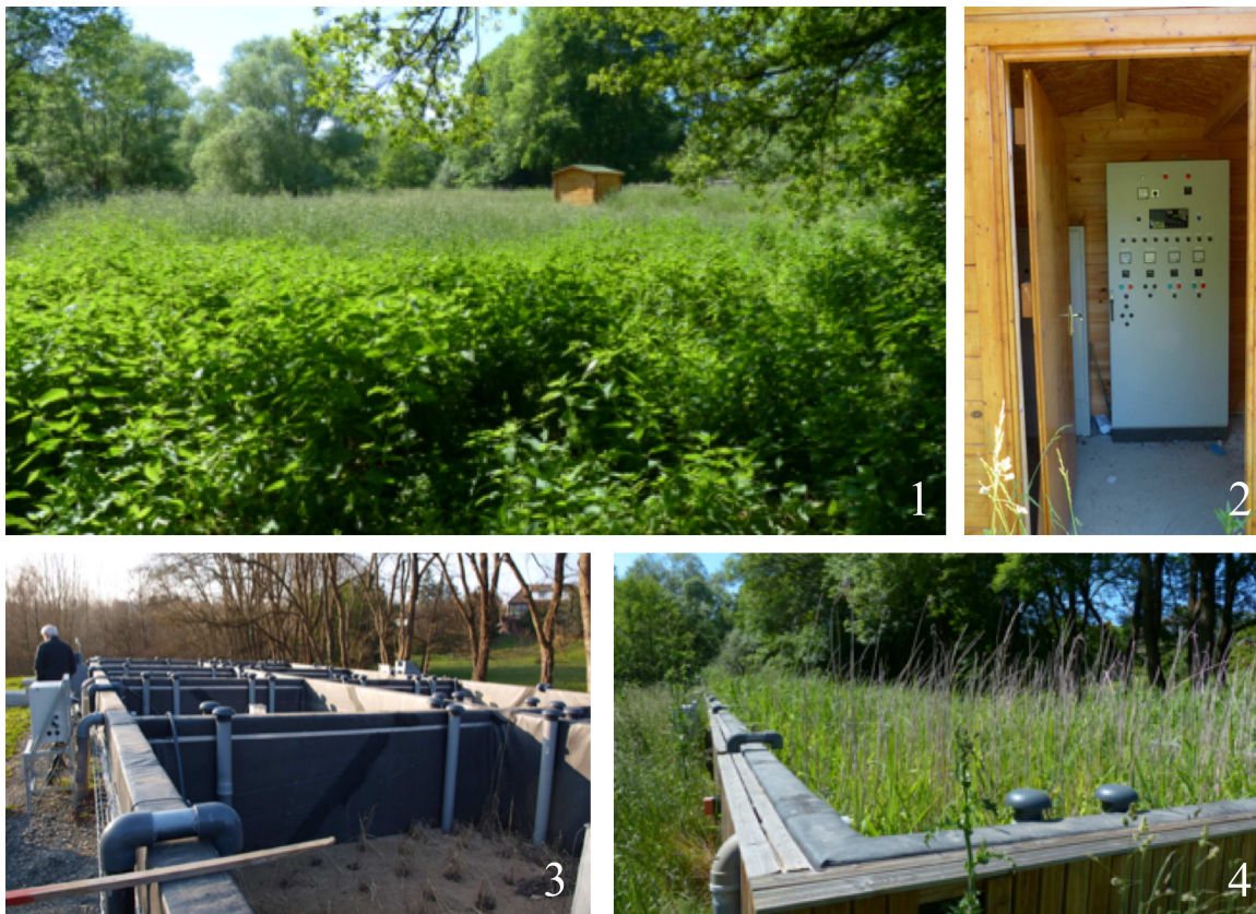
figure 7 : les pilotes (photos 1, 2 et 4 : 2013 ; photo 3 : 2009)

Le prototype (figure 8) est un filtre planté de roseaux de 530 m 2 de surface destiné à accueillir les rejets d'un déversoir d'orage en vraie grandeur. L'ouvrage est construit en bordure d'un lotissement de maisons individuelles. Il prend la place d'un terrain vague formé d'un ancien remblai de terres et de déchets de chantier. Il est constitué d'un bassin fait de gabions remplis de galets et d'un remblai de terre (photo 1). Le bassin est divisé en deux parties permettant une alimentation en parallèle ou successive selon la quantité des eaux de ruissellement des parcelles urbanisées avoisinantes à traiter. Chacune des parties est équipée d'un filtre planté de roseaux d'une surface de 265 m 2 . Le bassin a une capacité de stockage de 1522 m 3 et de traitement d'une pluie d'orage de période de retour annuel générant un volume de 1160 m 3 . Les bassins sont instrumentés à l'aide de capteurs qui permettent de suivre la qualité et la quantité des eaux dans le dispositif et l'évolution des filtres. L'ouvrage est peu paysagé, les berges du bassin sont composées de graviers. L'ensemble du prototype est ceint d'une palissade de deux mètres de haut qui en interdit l'accès et en limite la vue (photos 2 et 3).