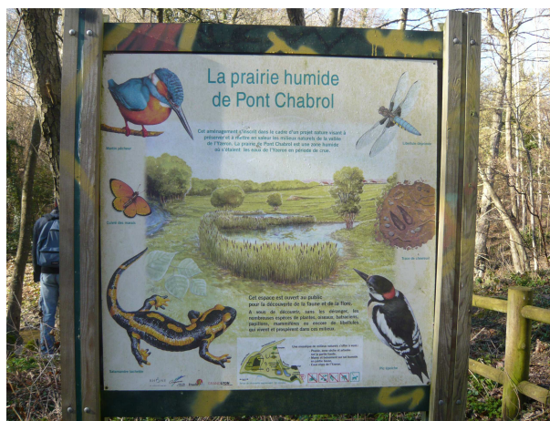
figure 5 : panneau d'information installé à Craponne

exclusifs. Ils dépendraient des temps de la fabrication (construction, maintenance, usage, destruction) : les aménagements passant d'un statut à l'autre selon l'avancée du projet et les situations des acteurs 1 . Ce glissement des aménagements entre naturel et artificiel ne semble pas poser de difficultés aux acteurs 2 . De fait, les panneaux d'information décrivent l'aménagement du site, le rôle des ouvrages hydrauliques dans l'assainissement urbain ainsi que la faune et la flore présentes sur les lieux (par exemple figure 5 et figure 6). En fonction de la configuration des sites, les espaces peuvent apparaître plus naturels et spontanés qu'artificiels et fabriqués ou vice-versa. De cette manière, les cas de Craponne et de Dardilly se distinguent de celui de Saint-Priest. Le mobilier urbain (bancs, candélabres, poubelles, etc.) y est moins développé et l'entretien moins important –les acteurs pouvant le qualifier de « minimum ». Des visites pédagogiques en lien avec les plantes et les animaux présents y sont organisées avec les écoles par des associations écologistes : dans ces situations, les ouvrages hydrauliques tendent à disparaître dans le décor 3 . Dans le cas de Saint-Priest, les visites organisées concernent aussi des praticiens de l'assainissement urbain et portent sur les installations hydrauliques.