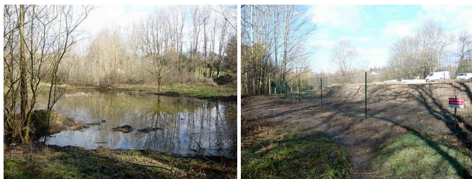
figure 2 : les zones humides et les pilotes, Craponne (Monin, 2010, p. 9)