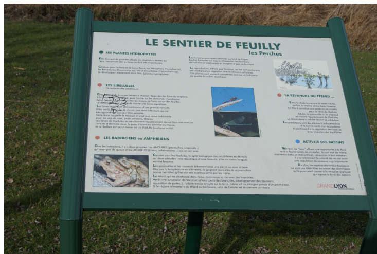
figure 6 : panneau d'information installé à Saint-Priest