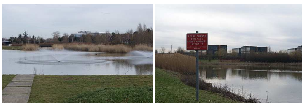
figure 3 : les bassins des Portes des Alpes, Saint-Priest (Monin, 2010, p. 9)