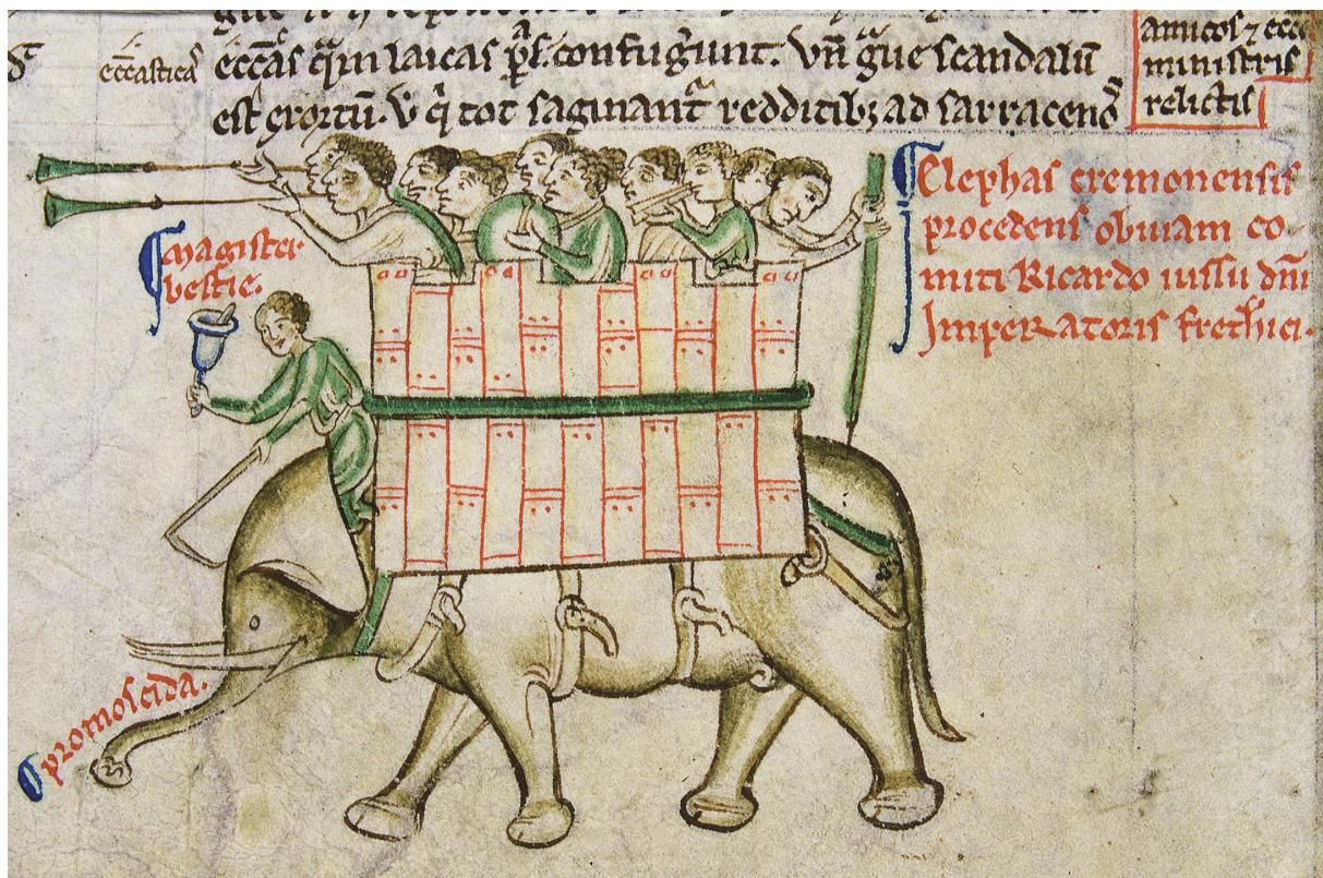
Éléphant de Frédéric II à Crémone Dans MATHIEU PARIS, Chronica Majora . Cambridge, Corpus Christi College, Parker Library, CCC Ms 16, f. 152v.