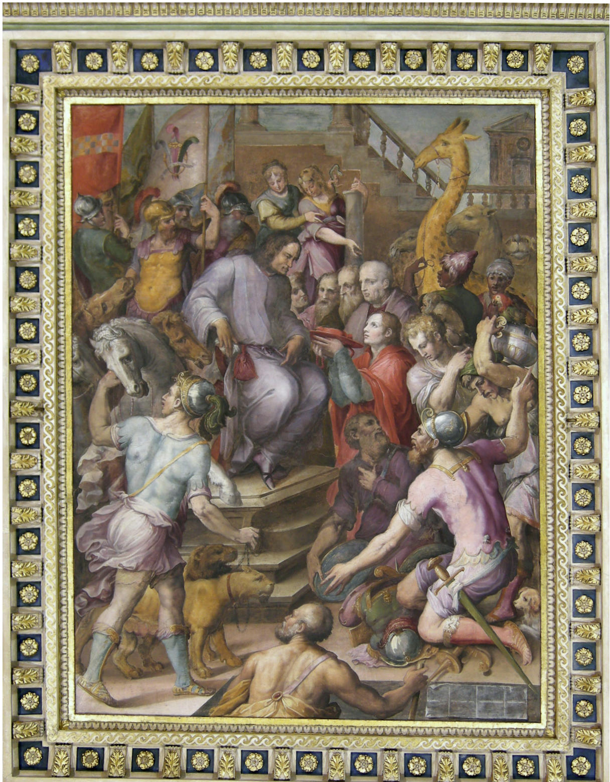
GIORGIO VASARI, Laurent de Médicis recevant les ambassadeurs Plafond peint. Ca. 1555-1556. Florence, Palazzo Vecchio.