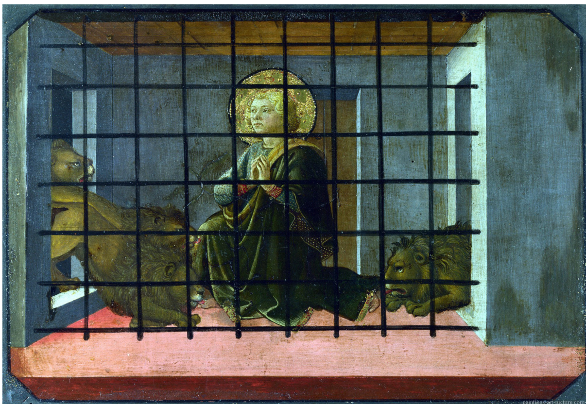
LIPPI FILIPPINO, Saint Mamas en prison avec des lions 1458. Huile sur bois. H. x L. : 26,5 x 40 cm. Londres, National Gallery, inv. n° 4868b.

cavea , perivolium , spiracium , seraglio (étymologie : serrare , fermer, enfermer) 22 . Au-delà du simple enclos, existe aussi un lexique relatif au jardin, notamment en Italie : viridarium (verger, jardin clos) ; hortus , vergier (jardin, verger), genoard (ou viridarium genoard , utilisé à Palerme au XII e siècle ; Genoard vient de l'arabe janna « paradis », Jannat Adn , jardin d'Eden, jannat al-ard , paradis sur terre).