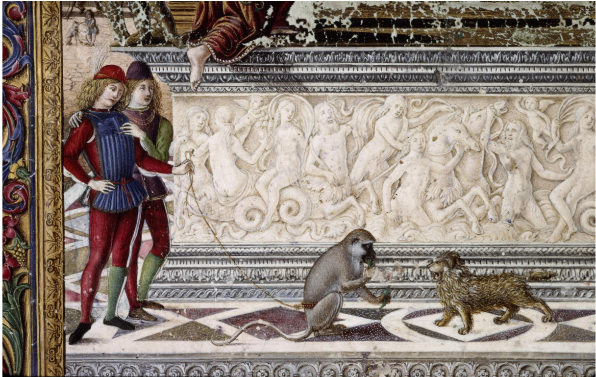
ATTAVANTE DEGLI ATTAVANTI, Jeunes pages tenant un singe en laisse dans Missel d'Attavente. Fin xv e siècle. Lyon, Bibliothèque municipale, ms. 5123, f. 27v.

comme le mentionne le Bestiaire de Guillaume le Clerc 48 . Rois, princes et même évêques possèdent des singes de compagnie, qu'ils vêtissent parfois de riches habits, comme la robe fourrée de gris, destinée au singe d'Isabeau de Bavière, à qui l'on fait également fabriquer un collier de cuir rouge ferré et garni de boucles... 49 . On faisait également fabriquer des billots de bois, auquel on attachait l'animal avec une chaîne, pour limiter ses mouvements à l'intérieur de la maison. D'autres singes pouvaient garder la cage au sein de la ménagerie : ainsi est-il fait mention de singes et de babouins gardés en captivité dans des caveis au château d'Azso Visconti en 1342, aux côtés de lions, d'ours, d'autruches, et d'une multitude d'oiseaux 50 .