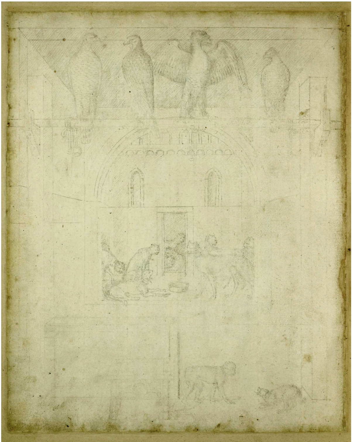
JACOPO BELLINI JACOPO, Esquisse d'une ménagerie 1440.

Dessin sur papier. H. x L. : 415 × 335 mm.