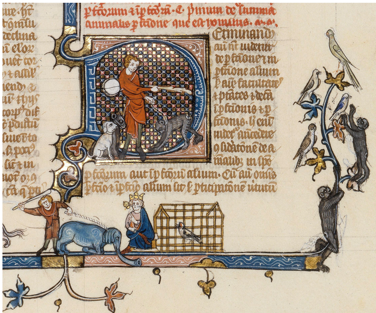
Éléphant présenté à un roi (dessin en marge inférieure) Dans ALBERT LE GRAND, De animalibus , XIII e siècle. Paris, BnF, Latin 16169, f. 280.

La ménagerie idéale réunit des animaux de provenances diverses, mais aussi le sauvage et le domestiqué ; son possesseur recrée ainsi un nouveau paradis où l'animal est regroupé, soigné, et maîtrisé. Le roi, grâce à sa ménagerie, est un nouvel Adam qui domine toute la Création ; un nouveau Noé qui la regroupe et la protège ; il est le « dompteur incomparable de toute substance animée » 93 ; il étend son pouvoir au-delà des mers par la possession des animaux les plus rares. La présence des animaux exotiques, comme le lion, le guépard, le dromadaire, l'autruche, le singe ou encore l'éléphant joue un rôle central dans la construction de cette image du Prince, mise en scène à la fois par la richesse du « trésor » de la ménagerie et par son exhibition au public.