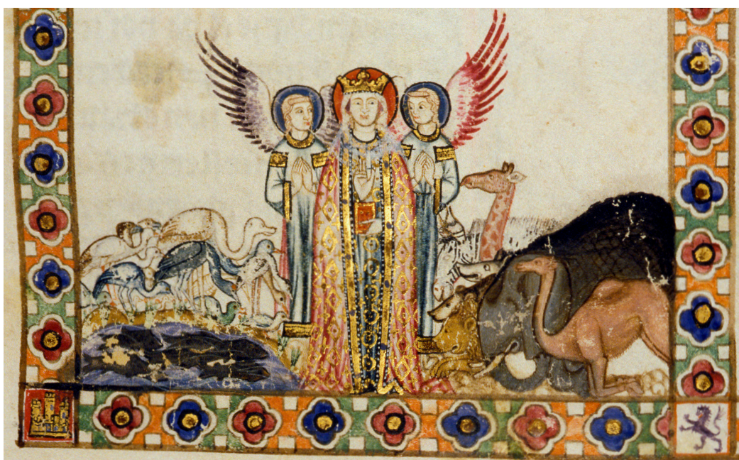
Cantigas de Santa Maria Séville. Ca. 1270. Madrid, Bibliothèque de l'Escorial, T.j.I, Cantiga 29.

Les animaux les plus fréquemment cités sont des espèces exotiques, sauf l'ours et le lynx. L'ours reste donc la vedette « européenne » des ménageries occidentales, et ce jusqu'à la fin du Moyen Âge ; il ne semble pas tout à fait disparaître au profit du lion, qui lui est bien présent depuis l'époque carolingienne 30 .