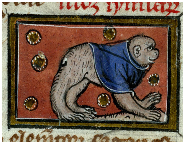
Singe vêtu d'un manteau Extrait de THOMAS DE CANTIMPRÉ, Liber de natura rerum , ca.1285. Valenciennes, Bibliothèque municipale, ms. 320, f. 77v.