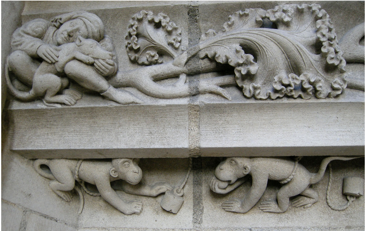
Décor de cheminée avec singes xv e -xvi e siècles. Bourges, palais Jacques-Cœur.