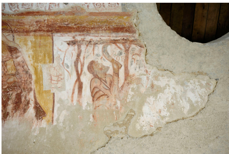
Saint-Savin-sur-Gartempe, peintures de la nef : la Vendange de Noé .