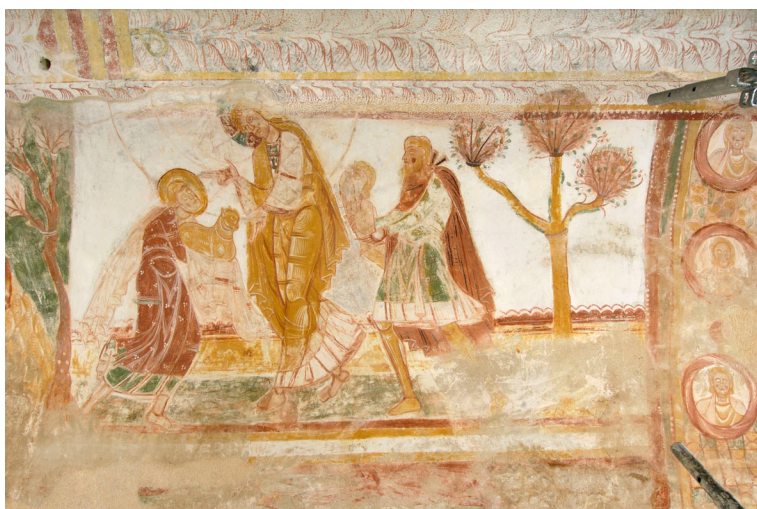
Saint-Savin-sur-Gartempe, peintures de la nef : le Sacrifice de Caïn et Abel .