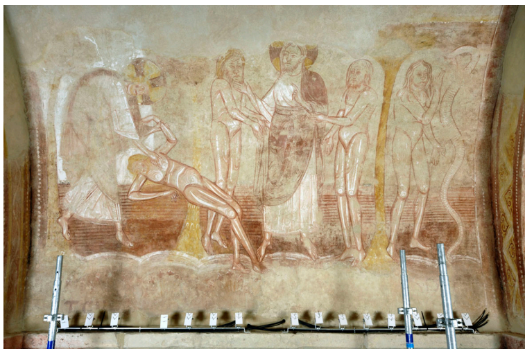
Saint-Savin-sur-Gartempe, peintures de la nef : la Présentation d'Ève à Adam . Phot. Brouard, Jean-Pierre. © CESCO.