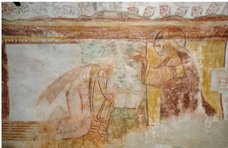
Saint-Savin-sur-Gartempe, peintures de la nef : le Sacrifice de Noé .