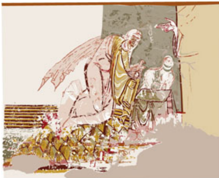
Saint-Savin-sur-Gartempe, peintures de la nef : relevé du Sacrifice de Noé .