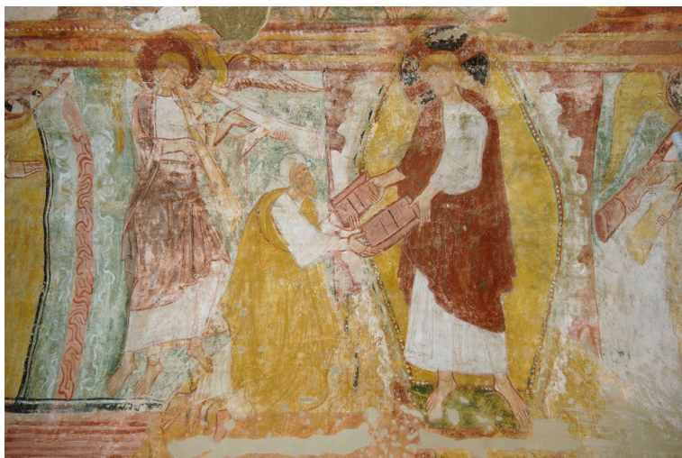
Saint-Savin-sur-Gartempe, peintures de la nef : la Remise des Tables de la Loi .