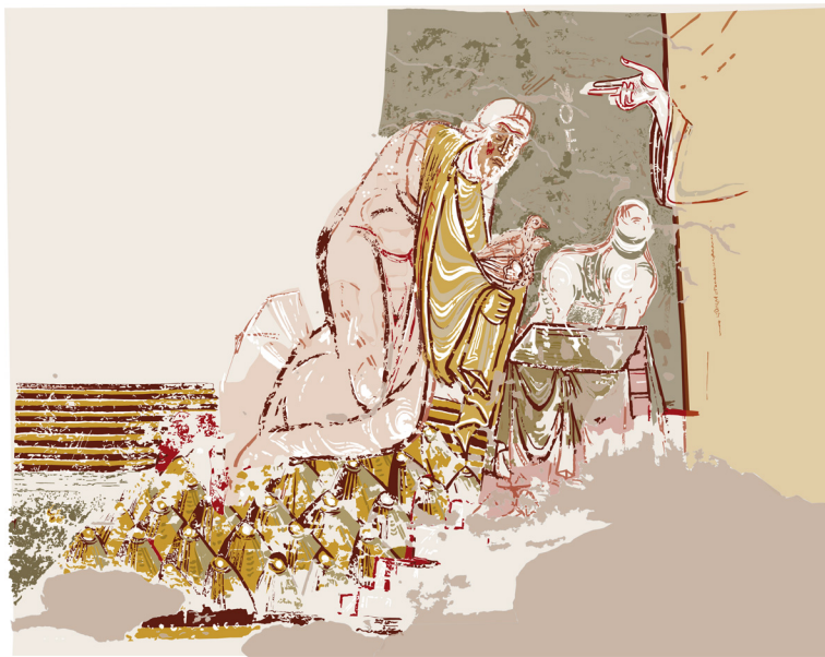
Saint-Savin-sur-Gartempe, peinture de la nef. Essai de restitution, Noé sans cape.