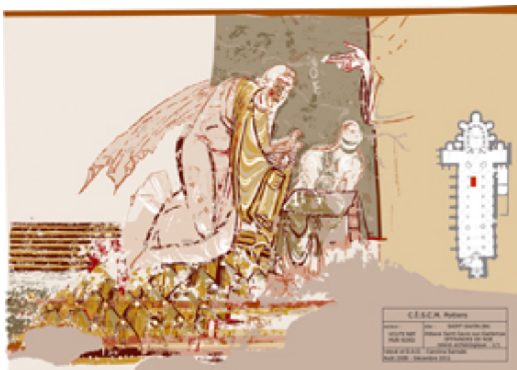
Saint-Savin-sur-Gartempe, peinture de la nef. Relevé stratigraphique du Sacrifice de Noé . Relevé Sarrade, Carolina.