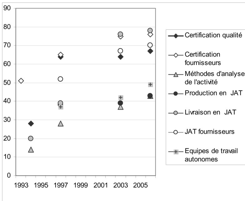
Graphique 1. Diffusion des outils de gestion dans l'industrie 1993-2006 (% des entreprises)

Lecture : la plupart des questions ne sont pas strictement comparables, une statistique manquante indique qu'il n'y a pas de question comparable dans l'enquête