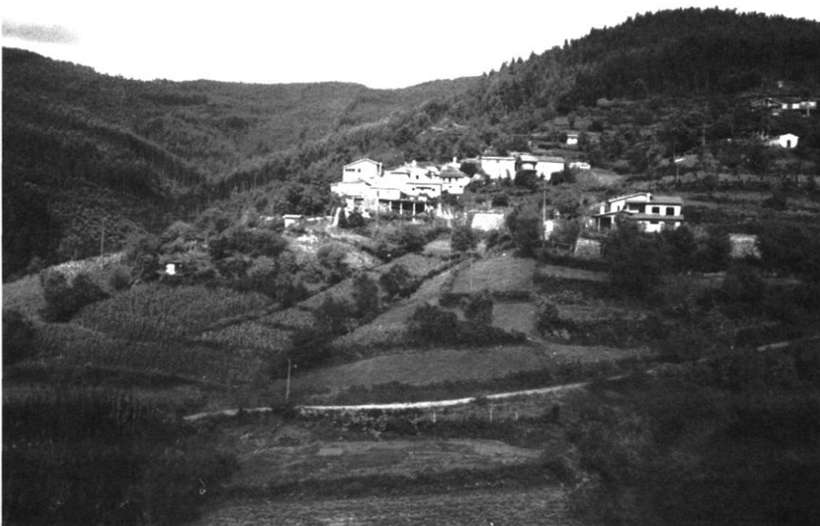
PHOTO 1 - En remontant la vallée d'Agueda sur le versant occidental schisteux, village de la paroisse de Castanheira do Vouga. Îlot de polyculture paysanne, noyé dans un manteau d'eucalyptus (cliché : L. RIEUTORT, 1995).

servatoire d'archaïsmes difficile à admettre à quelques kilomètres des villes de la côte. Un exemple en apparence aussi extrême suscite l'intérêt : comment comprendre cet apparent immobilisme dans le contexte d'un Portugal désormais européen ? Retard réel anormalement prolongé, ou bien façade trompeuse dissimulant une adaptation discrète aux exigences de la vie moderne ? Dans tous les cas, il reste à déceler les ressorts d'un comportement quelque peu énigmatique et à s'interroger au-delà sur les possibilités de préservation durable d'une telle situation.