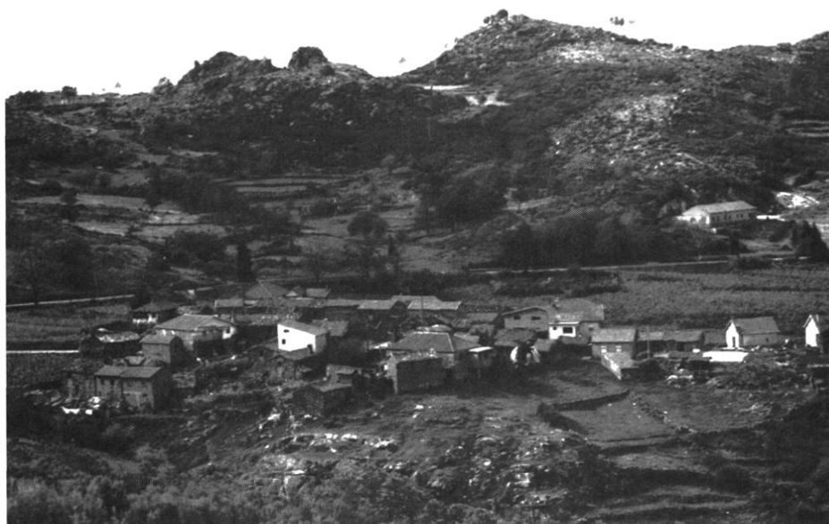
PHOTO 2 - Montagne granitique de l'est : finage du village de Cadraço au-dessus de la station de Caramulo. Champs de maïs en terrasses et prairies laissent la place aux vastes landes à genêts des sommets.

Le parcellaire agricole , divisé à l'extrême, juxtapose de minuscules lopins à l'échelle de quelques ares, souvent enclos de murs de pierres, parfois aménagés en solides terrasses lorsque la pente devient forte. Sur les champs, quelquefois limités par les petits canaux d'irrigation, le comptant demeure la règle. Tout se mêle, accumulé sur un espace étroit : maïs partout, enchevêtré de légumes près des villages -haricots, choux, citrouilles...- ou planté au-dessus de quelques autres céréales ou de fourrages en vert ; le tout est souvent bordé de guirlandes de treilles portées par de hauts piquets de granit ou de bois. La vigne en plantation homogène n'apparaît guère, si ce n'est vers le bas à l'approche de l'avant-pays (Dão). L'espace cultivé est lui-même contraint à d'étroits périmètres par le relief ou la maigreur des sols : petites combes de vallons sur quelques gradins qui rompent la raideur des ver-