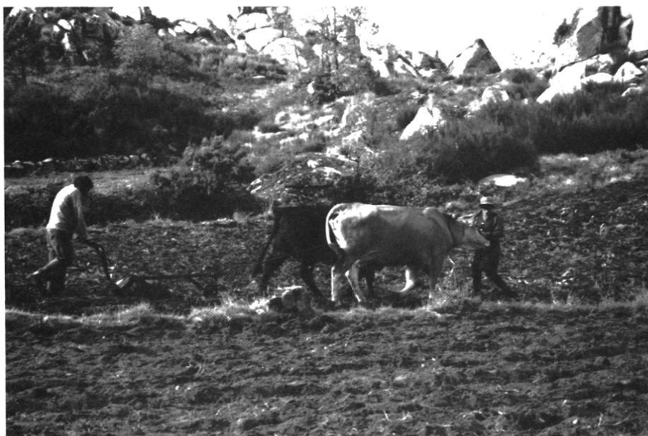
PHOTO 3 - Labour à l'araire sur un replat dominé par les tors de granit, non loin du hameau de Jueus.

sants, alvéoles plus amples qui se dilatent davantage au niveau des surfaces plus calmes des sommets. Mais le territoire agricole reste toujours fractionné en archipel au cœur de vastes étendues incultes, bois ou lande maigre, champs immenses de roches ruini-formes aux ruptures de pentes. La S.A.U. finalement ne couvre qu'une part très réduite de l'ensemble (15 % à l'ouest, de 5 à 10 % seulement à l'est) et la terre labourable est encore plus chichement comptée (5 % en moyenne, rarement plus de 10%). Ainsi de la parcelle au terroir, tout apparaît menu, mêlé, et renforce l'idée de morcellement généralisé.