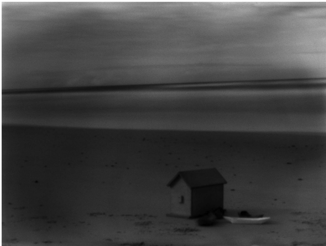
Piece of Land and Sea II, 2012 pigment print on photo rag, 54 x 67 cm