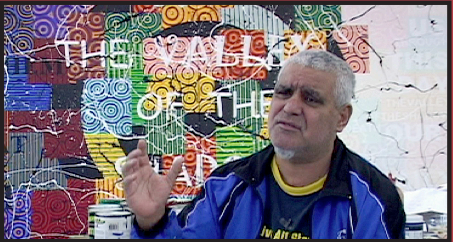
What is Aboriginal art ? , 2012 Video still, Richard Bell in conversation, DVPAL Stereo, 12 mins