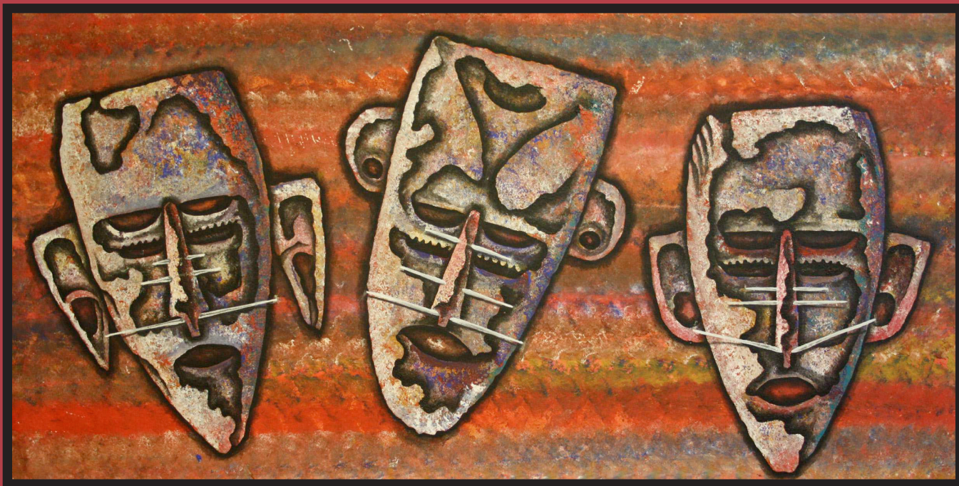
Mawal 1, 2012 acrylic on canvas, 71 x 137 cm