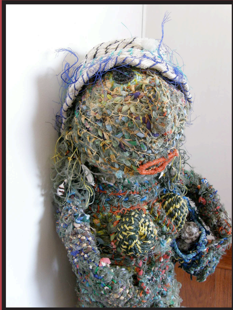
Usari , 2012 ghost nets, 60 x 10 cm