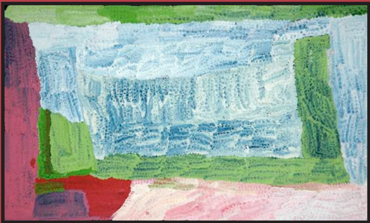
Martakulu , 2011 acrylic on linen, 106 x 61cm