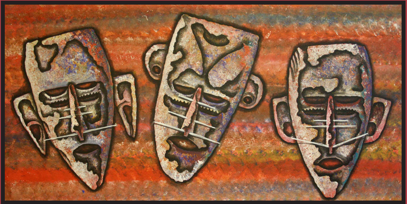
Mawal 1, 2012 acrylic on canvas, 71 x 137 cm