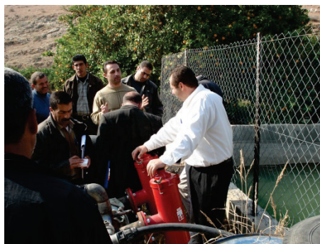
Formation d'agriculteurs du PFU à l'irrigation dans la région de Naplouse.

Etant donné l'absence d'une autorité politique palestinienne jusqu'en 1993, certaines organisations de développement se sont développées avec des agendas agricoles. C'est le cas du Palestinian Agricultural Relief Committee (PARC), émanant du parti du peuple palestinien (PPP, d'obédience communiste) qui est devenu après sa création en 1983 la structure puissante que l'on connaît (Abu Sada, 2007). Très implanté dans toutes les régions des territoires occupés, le PARC a créé le Palestinian Farmers Union (PFU) en 1992. En 2011, ce syndicat revendiquait environ 9000 agriculteurs, faisant de lui le plus grand syndicat agricole palestinien. Ses actions portent à la fois sur le plaidoyer interne (revendications envers l'Autorité palestinienne) et externe (notamment au travers de la « campagne populaire contre le mur et la colonisation ». Le PFU est également porteur de programmes de développement (amélioration de la production de l'huile d'olive, gestion de l'eau agricole, etc.). Toutefois, les critiques envers son président (autoritarisme, corruption) ont ébranlé le PFU dont il est difficile de dire si les effectifs sont stables.