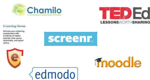
Imagen 2: Herramientas colaborativas para el aprendizaje.