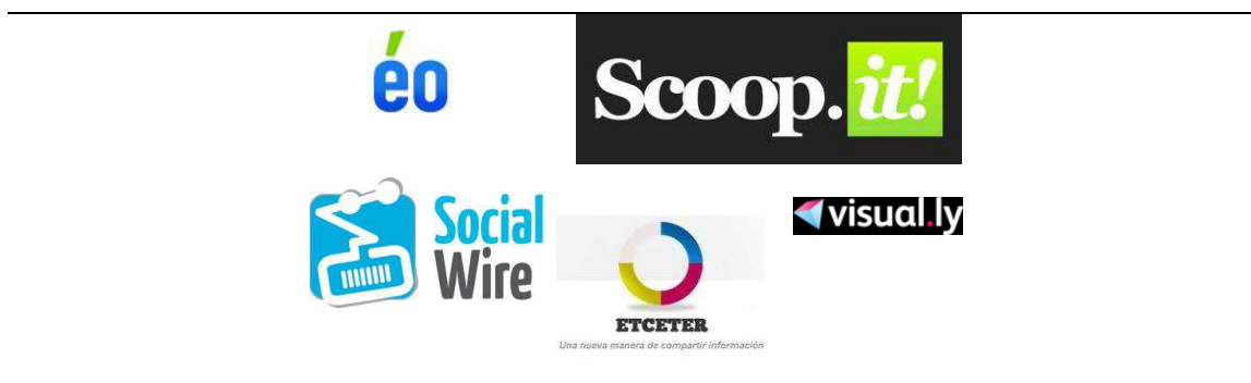
Imagen 3: Herramientas para la gestión del conocimiento.