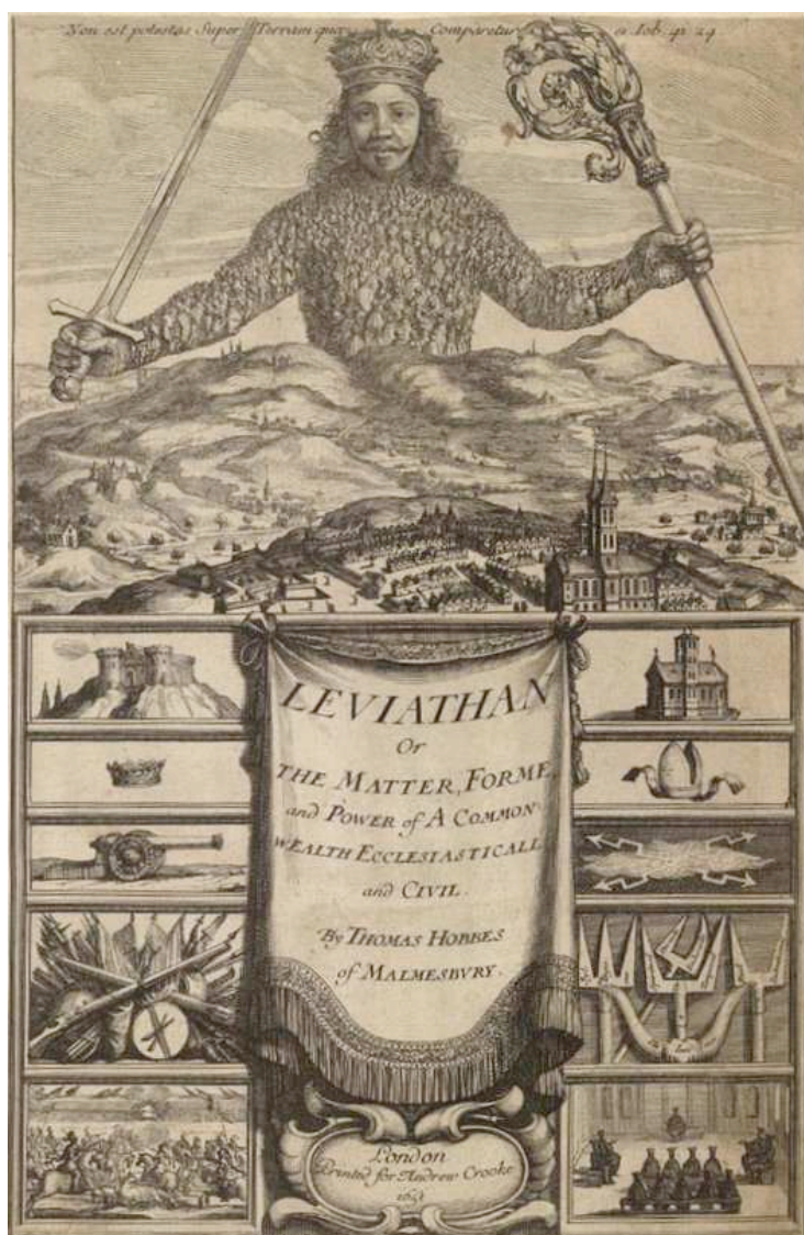
Gravure d'Abraham Bosse servant de frontispice au Leviathan de Thomas Hobbes (1651). Le roi, qui brandit la crosse de l'autorité spirituelle et le glaive du pouvoir temporel, a un corps composé de la multitude de ses sujets.

l'affirmation progressive du pouvoir royal sur les sujets. On tient là, au passage, l'un des mécanismes qui ont déstabilisé les sociétés d'Ancien Régime, jusqu'à leur chute : plus le pouvoir royal se renforçait et se centralisait, plus, par analogie, les sujets se constituaient en individus souverains 2 ; et plus les sujets s'éprouvaient comme individus souverains, plus le pouvoir royal se mettait à leur peser. L'aporie de la monarchie centralisatrice était que, de son propre mouvement, elle engendrait des sujets de moins en moins disposés à souffrir son autorité. L'analogie entre la structure sociale et la structure individuelle n'était plus un facteur de stabilité mais, au contraire, une source croissante de tension.