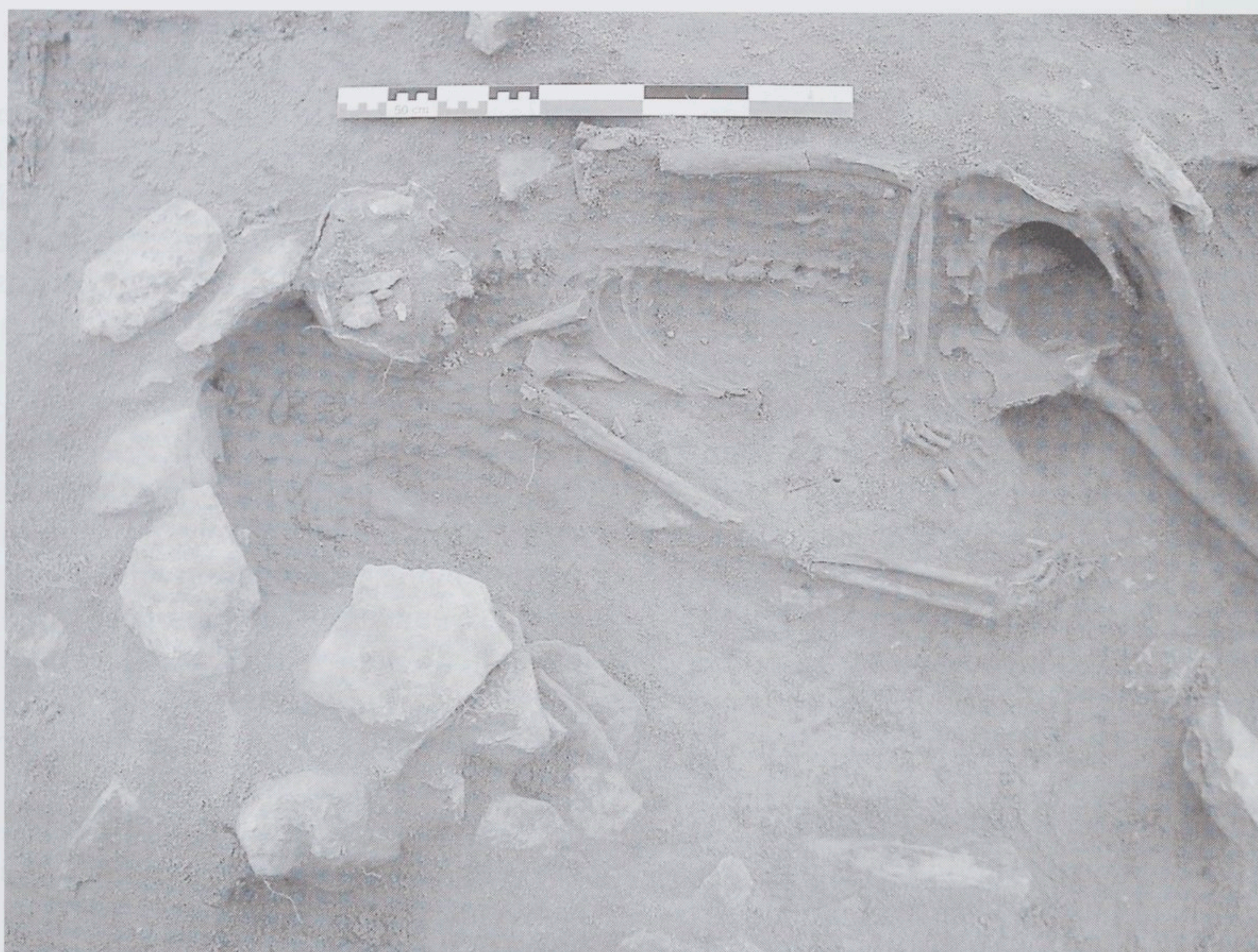
Fig. 4 : Truyes (37) «Les Vignes de Saint-Blaise I». Détail de la partie supérieure de la sépulture F4, vue de l'est.

sol précis, peut-être une mémoire de la position du défunt dans la fosse.