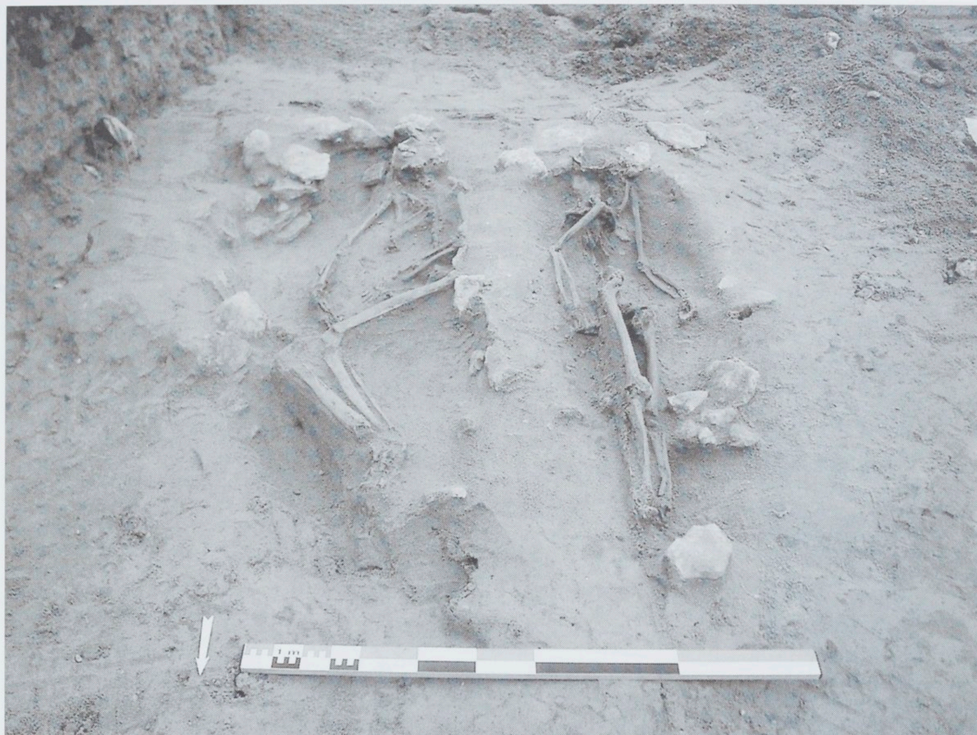
Fig. 3 : Truyes (37) «Les Vignes de Saint-Blaise I». Les sépultures vues du nord.