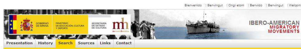
Imagen 4. El Portal de Movimientos Migratorios Iberoamericanos en inglés.

Otro de los aspectos novedosos del Portal de Movimientos Migratorios Iberoamericanos es la incorporación del multilingüismo. Tanto los contenidos, como la información contextual del Portal, están en todas las lenguas cooficiales del Estado español y en inglés (Ver Imagen 4).