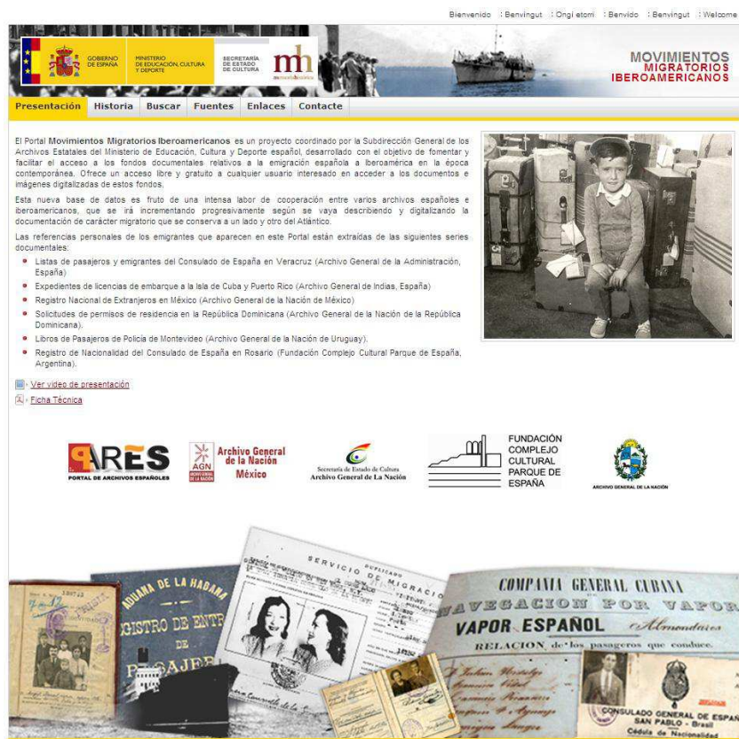
Imagen 1. Pantalla de inicio del Portal de Movimientos Migratorios Iberoamericanos.

Uno de los criterios introducidos para la búsqueda de emigrantes es el género. Filtrando por este criterio, se obtiene como resultado un total de 17.408 mujeres emigrantes en la base de datos, es decir, un 23% del total de personas que aparecen en los documentos descritos. (Ver Gráfico 1).