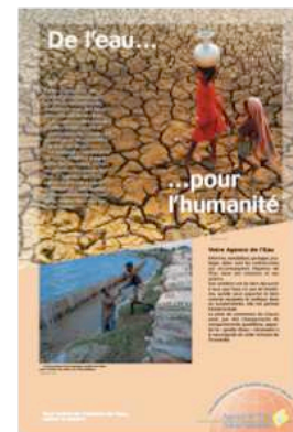
Figure 2 : Exemple de fiche synoptique

ou Francois Dussenty Tél. 05 61 36 82 21 francois.dussenty@eau-adour-garonne.fr