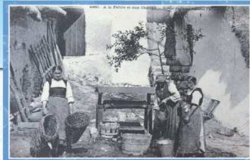
A la ferme, les corvées d'eau étaient une des nombreuses tâches dévolues aux femmes.

Lorsque les mares étaient tarées sur les plateaux, les besoins en eau des troupeaux nécessitaient de faire des dizaines de kilomètres chaque jour pour aller chercher l'eau dans les plus proches vallées et la ramener dans des « tonnes à eau ». Sachant qu'à l'époque les plus grandes fermes possédaient au moins 30 à 40 bovins s'abreuvant chacun avec une soixantaine de litres d'eau par jour, sans compter les chevaux et d'éventuels moutons, on guettait le moindre nuage dans le ciel en espérant le retour de la pluie.