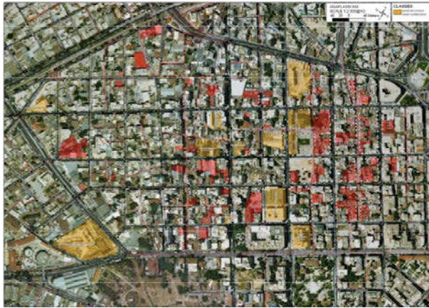
Figure 2.1.1.2-2: Le quartier de Metaxourgeio.

En rouge, les propriétés des habitants participant à l'association à but non-lucratif KM 6 .