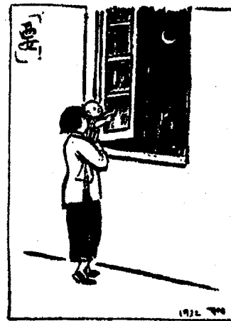
Ertong xiang 兒童相 (Scènes enfantines), Shanghai : Kaiming shudian, 1945