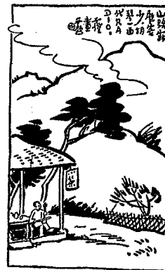
Xin Zhonghua 新中華 (Nouvelle Chine), 25 mai 1935, vol. 3, n°10

Déserts sont les sentiers de montagne, Rares sont les clients, La musique du violon remplace celle de la radio