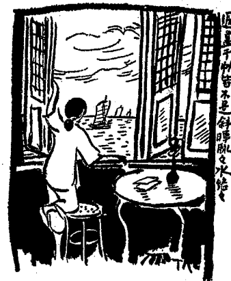
Zikai manhua, op. cit.

Le soleil couchant brille sur le fleuve tranquille