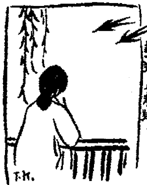
Zikai manhua 子愷漫畫 (Caricatures de Zikai), Shanghai : Kaiming shudian, 1926