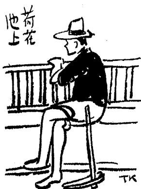
Shenbao 甲報 (Journal de Shanghai), 15 septembre 1934

Deux personnages de dos regardant passer au loin un train à vapeur expriment encore par leur attitude figée leur sentiment dans « Le train de Shanghai » ( Dao Shanghai qu de 到上海去的) (1935) : ici, c'est l'aspiration à un ailleurs, le désir d'évasion, l'espoir d'une autre vie, symbolisé par le train (fig. 11).