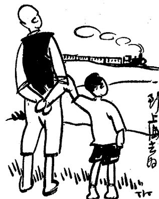
Shanghai : Tianma shudian, 1935