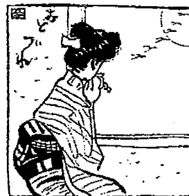
Takehisa Yumeji 竹久夢二 (1884-1934), Tokyo, 1909, fac-similé de l'édition originale, non paginé