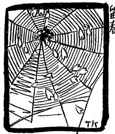
Zikai manhua , op. cit.

Une lecture bouddhique pourrait même suggérer que la souffrance des paysans dans les rizières, tout comme le chagrin des amants séparés, n'est que douleur inutile qui n'est qu'illusion et qu'il faut supprimer. La réminiscence littéraire, dès lors, se mettrait au service du promeneur, de l'exilé, du solitaire ou du contemplatif, désireux de s'épancher, de laisser libre cours aux émotions qui l'étreignent, chez un artiste qui revendique l'héritage d'une tradition, tout en cherchant dans le même temps à s'en affranchir.