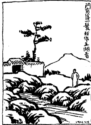
Gu shi xin hua 古詩新畫 (Poèmes anciens, nouvelles peintures), Shanghai : Kaiming shudian, 1945

Devant ma porte, un cheveu de ruisseau Devient pour moi la vue des Cinq Lacs