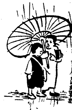
Shenbao 申報 (Journal de Shanghai), 26 mai 1934

Ge sheng yu sheng lü sheng de jiaoxiangyue 歌声雨声履声的交响乐 La symphonie du crépitement de la pluie, du bruit de pas et de la chanson