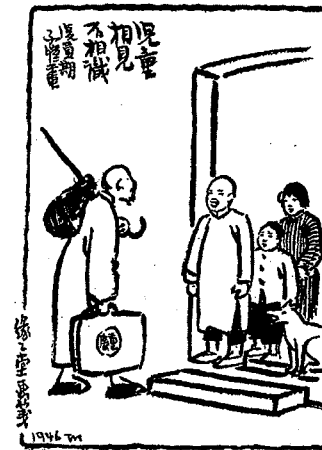
Yoyou huaji 幼幼畫集 (Images pour les petits), Shanghai : Ertong shuju, 1947

Figure 6 : Ertong xiang jian bu xian shi 兒童相見不相識 Les enfants lorgnent le passant, nul ne le reconnaît