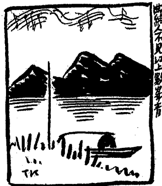
Zikai manhua, op. cit.

Lorsque la musique s'achève on ne voit plus personne Une multitude de sommets verdoyants se dressent sur le fleuve