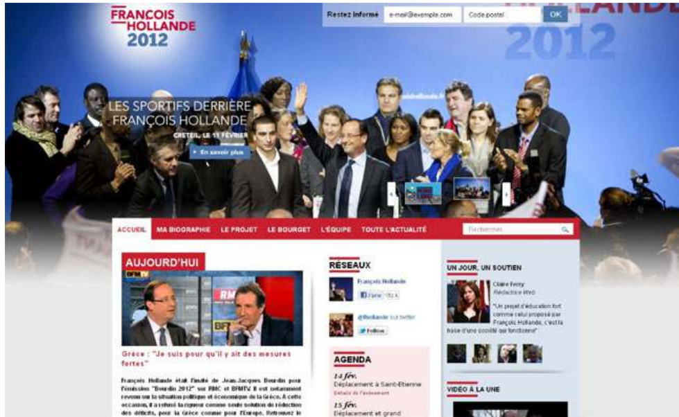
Figure 1 - Capture d'écran de la page d'accueil de francoishollande.fr , le 14 février 2012

d'ailleurs que la petite taille peut être aussi « connotée positivement » 15 , à travers notamment des héros populaires valorisés malgré leur taille, tel qu'Astérix. Sur leurs sites de campagne, les équipes numériques des deux candidats n'hésitent pas à mettre en ligne des images les montrant, entourés de personnes de plus grande taille. L'objectif est plutôt de rendre visible le collectif, que ce soit le soutien des adhérents (cf. figure 1) ou la proximité affichée du candidat avec les citoyens.