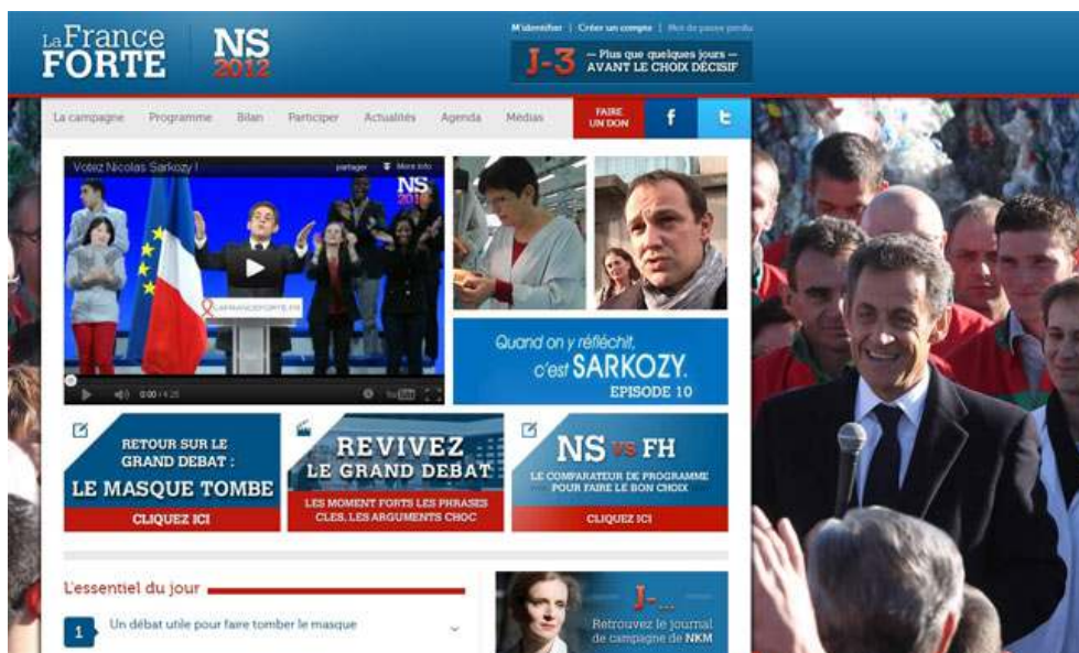
Figure 7 - Capture d'écran de la page d'accueil de Lafranceforte.fr, le 3 mai 2012 - Au lendemain du débat du second tour.