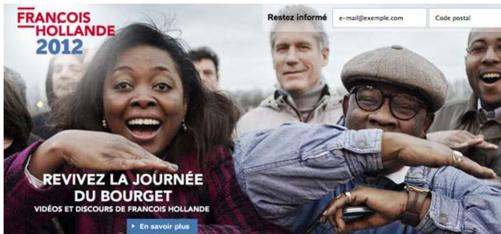
Figure 2 - Capture d'écran du site de campagne de F. Hollande, après le meeting du Bourget