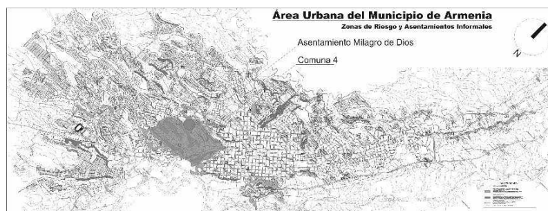
Ilustración : Localización Comuna 4 y Asentamiento Milagro de Dios

Dentro de este fenómeno habitacional existente en la ciudad, uno de los asentamientos que presenta mayor nivel de vulnerabilidad es el llamado “Milagro de Dios” que alberga cerca de 80 familias, un buen número de ellas afrodescendientes provenientes de la costa pacífica colombiana en condiciones de desplazamiento.