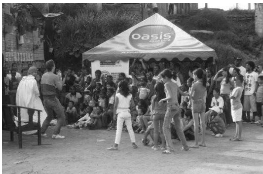
Ilustración : Grupo de Teatro de la UGCA en una actividad lúdico - investigativa

Equipo TAG Territorios Posibles UNLP-CONICET y Universidades asociadas del GDRI Groupe de Recherche CNRS INTI International Network of Territorial Intelligence Instituto IdhICS, Facultad de Humanidades y Ciencias de la Educación, Universidad Nacional de La Plata - CONICET