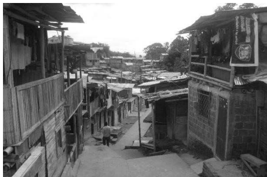
Ilustración : Viviendas del Asentamiento