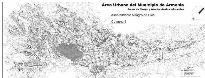
Ilustración : Localización Comuna 4 y Asentamiento Milagro de Dios

Dentro de este fenómeno habitacional existente en la ciudad, uno de los asentamientos que presenta mayor nivel de vulnerabilidad es el llamado “Milagro de Dios” que alberga cerca de 80 familias, un buen número de ellas afrodescendientes provenientes de la costa pacífica colombiana en condiciones de desplazamiento.