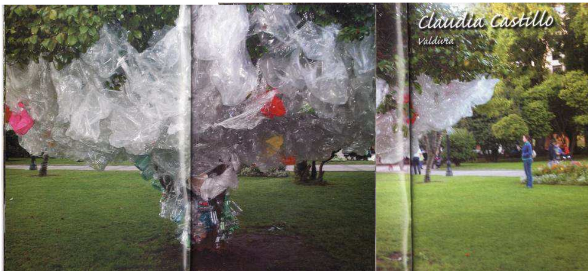
“Un Árbol, Un Artista”