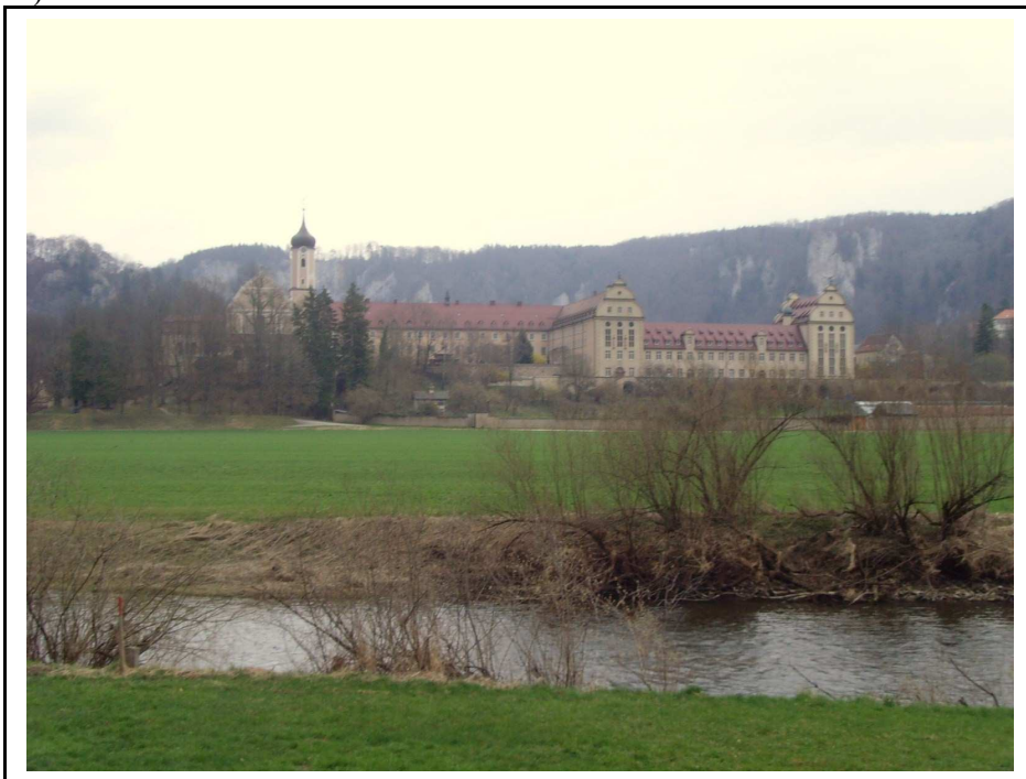
Photo 1 : Le Danube à Beuron avec en arrière-plan l'abbaye Saint-Martin

La complexité géologique associée à l'espace des sources du Danube n'est pas un cas isolé (voir le tracé du Rhin) et nous laissons le soin aux connaisseurs de développer d'autres exemples. Néanmoins, il paraissait important de mettre en lumière la spatialité spécifique des sources du Danube dans le Jura Souabe. Entre les sources et la ville d'Ulm, le fleuve parcourt 251kms dans le Land du Bade-Wurtemberg et son lit ne dépasse pas 30m de long. C'est pourquoi le Danube garde des allures de rivière avant d'atteindre la Bavière. La photographie suivante illustre la petitesse du lit du Danube, environ 10m, dans la ville de Beuron située au bord du fleuve entre les villes au Sud-Ouest de Tuttlingen et au Nord-Est de Sigmaringen (cf schéma 1).