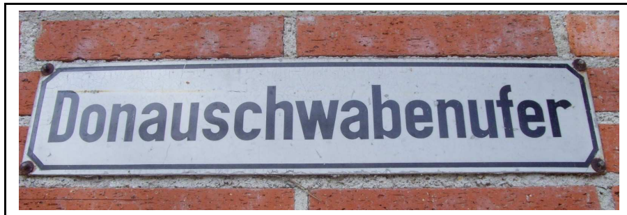
Photo 2 : Plaque commémorative des souabes du Danube, sur la rive gauche du fleuve à Ulm

Puis, après la Seconde Guerre mondiale ou plus récemment, après la fin de la Guerre froide, certains souabes sont revenus en Allemagne, souvent pour des raisons économiques. La ville d'Ulm est fière de mettre en valeur les souabes et leur a consacré une journée du souvenir. Le ministre de l'intérieur du Land insiste sur le lien des populations souabes avec leur passé et la patrie dans laquelle ils vivaient. Il affirme: « Qu'avec ma présence, je souhaiterais mettre en exergue le lien indéniable que j'ai avec les expatriés et leurs souhait de perpétuer la culture souabe ». La plaque commémorative ci-dessous rend hommage à ces hommes et ces femmes partis d'Ulm en direction de cette Europe centrale légendaire.