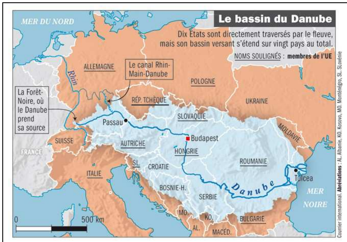
Carte 1 : Présentation générale de la géopolitique danubienne, quels espaces concernés ?